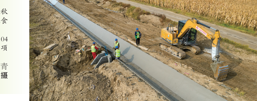
日前,托克托县农牧部门持续推进秋冬季高标准农田水利基本建设,确保粮食稳产增收。 据了解,托克托县耕地总面积为104万亩,截至目前,累计实施高标准农田项目89万亩。 ■本报记者 苗青 通讯员 王建宏 李浩敏