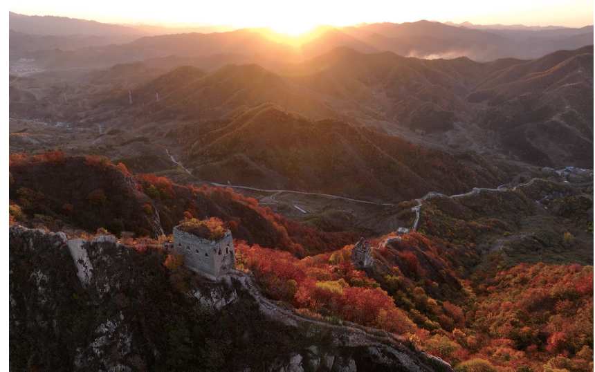
10月26日拍摄的河北省唐山市迁西县青山关长城秋景(无人机照片)。

在兜底保障方面,人社部门将对脱贫家庭、低保家庭、零就业家庭以及身有残疾和长期失业等困难毕业生进行重点帮扶,优先推荐岗位,优先落实政策,优先组织培训见习;对2024届在校的困难大学生,发放一次性求职创业补贴,切实减轻他们的求职负担。