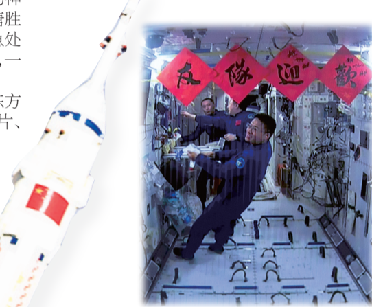
10月26日在北京航天飞行控制中心拍摄的神舟十六号乘组准备迎接新队员。