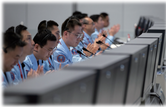
10月26日,在北京航天飞行控制中心,工作人员在紧张工作。

此外,我国第四批预备航天员选拔工作也正有序进行,计划选拔12至14名预备航天员,年底前完成全部选拔工作。林西强介绍,共有20余名候选对象进入最后定选阶段,其中,来自香港和澳门地区的数名候选对象进入载荷专家选拔的最后环节。