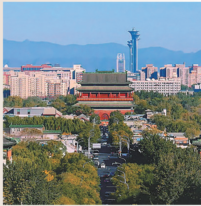
《登场了！北京中轴线》节目视频截图。