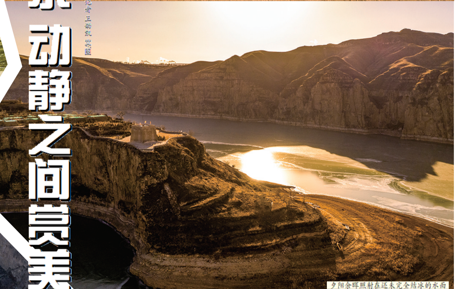
夕阳余晖照射在还未完全结冰的水面