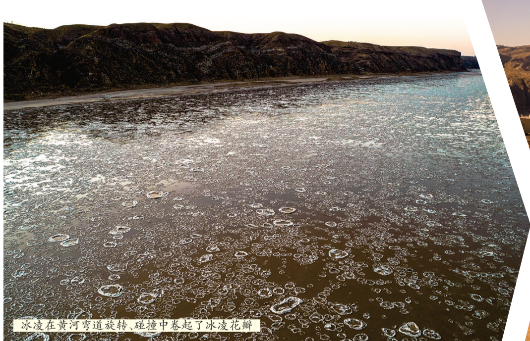
冰凌在黄河弯道旋转、碰撞中卷起了冰凌花瓣

冬季的内蒙古清水河老牛湾国家地质公园静谧而美丽,呈现出一幅冰水相融、动静结合的冬日美景。冰封的河流宛如一条银带,静静地躺在峡谷之中,与周围的山峦相映成趣。未结冰的河水则潺潺流淌,清澈见底,仿佛在诉说着大自然的生命力。在阳光的照耀下,河面晶莹剔透、波光粼粼,远处山峦起伏,与河流、冰雪共同构成了一幅壮美的画卷。