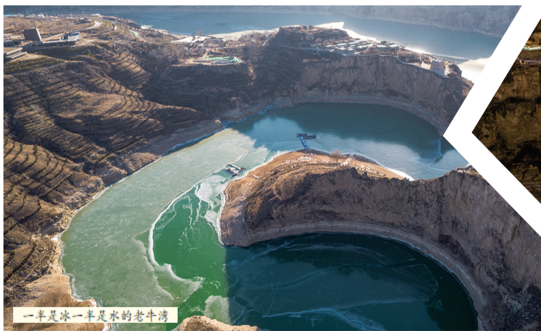
一半是冰一半是水的老牛湾