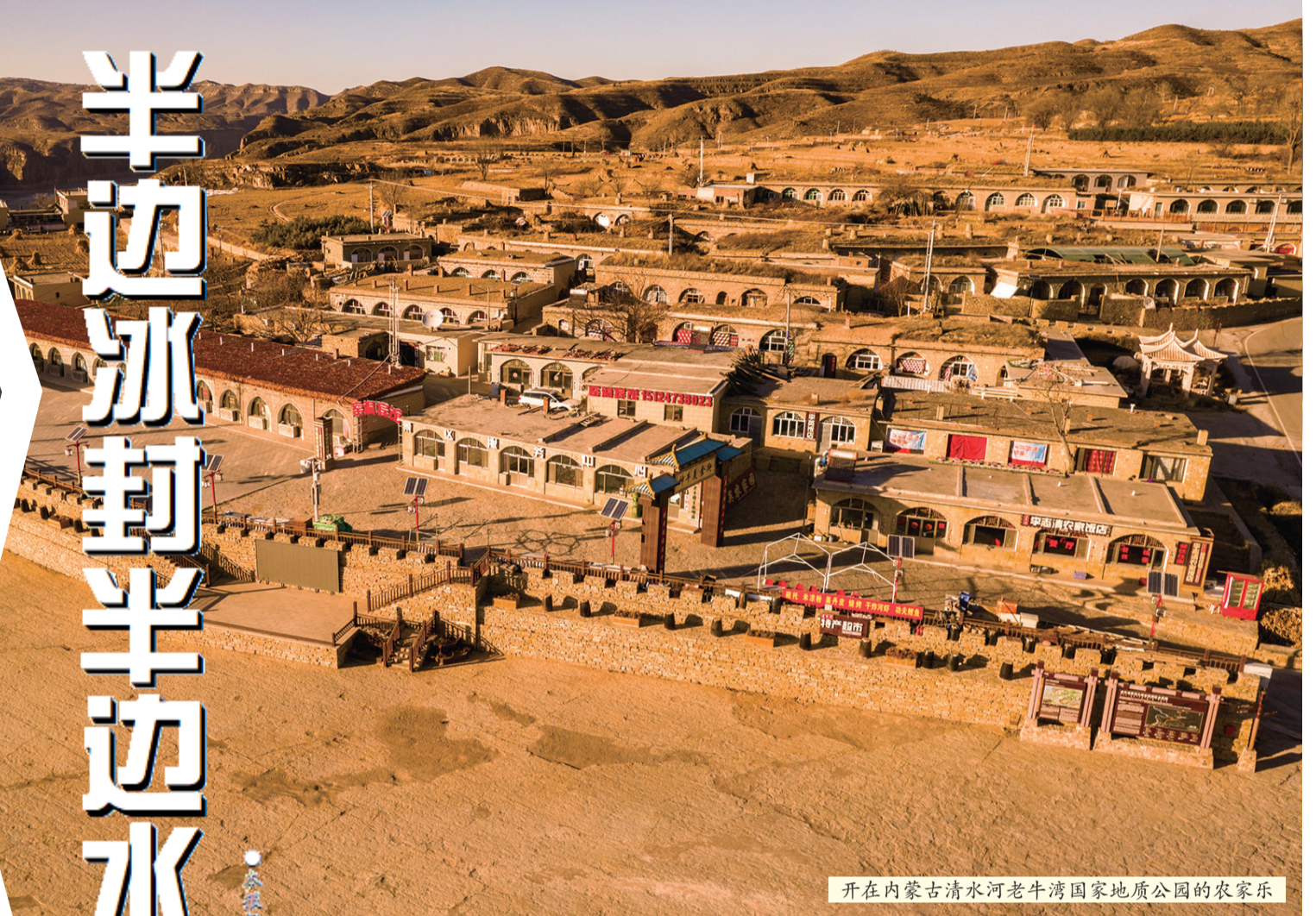
开在内蒙古清水河老牛湾国家地质公园的农家乐