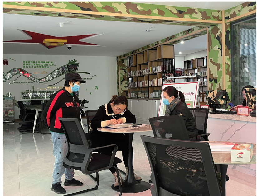
工作人员为居民办理居住证明