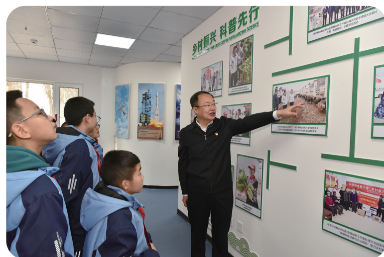
近日,在市科协青少年教育实践基地内,党的二十大代表韩佳彤教授正带领部分师生代表进行观摩体验。