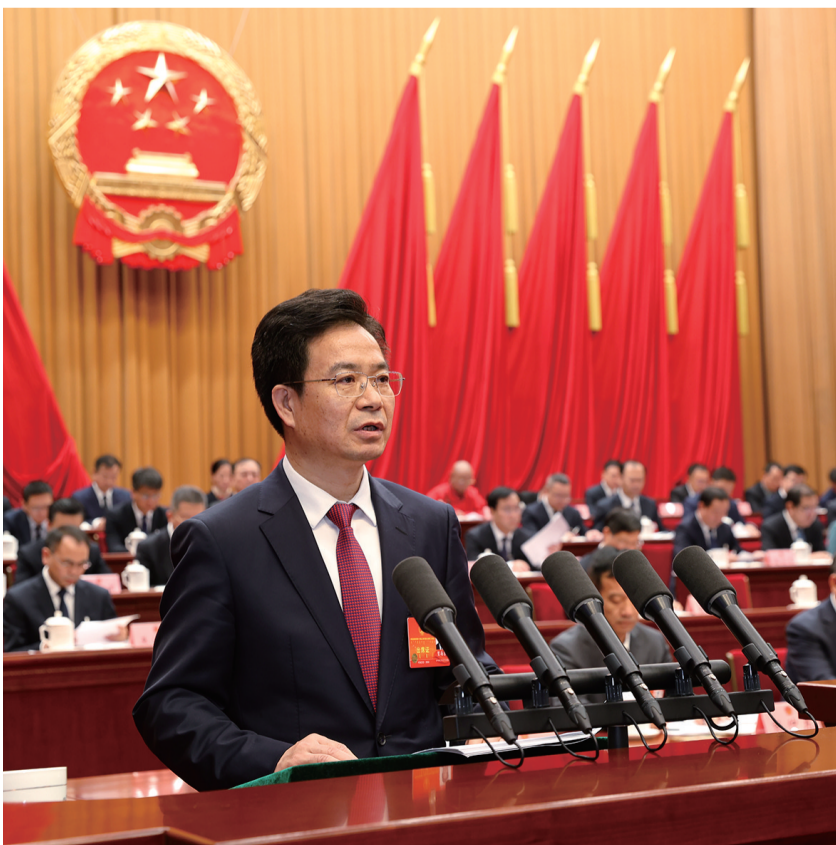
市长贺海东作政府工作报告。