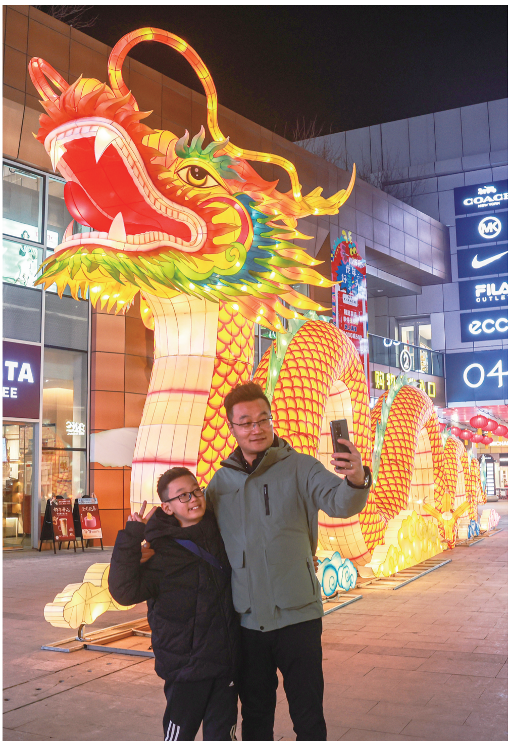
市民在龙形灯前合影留念