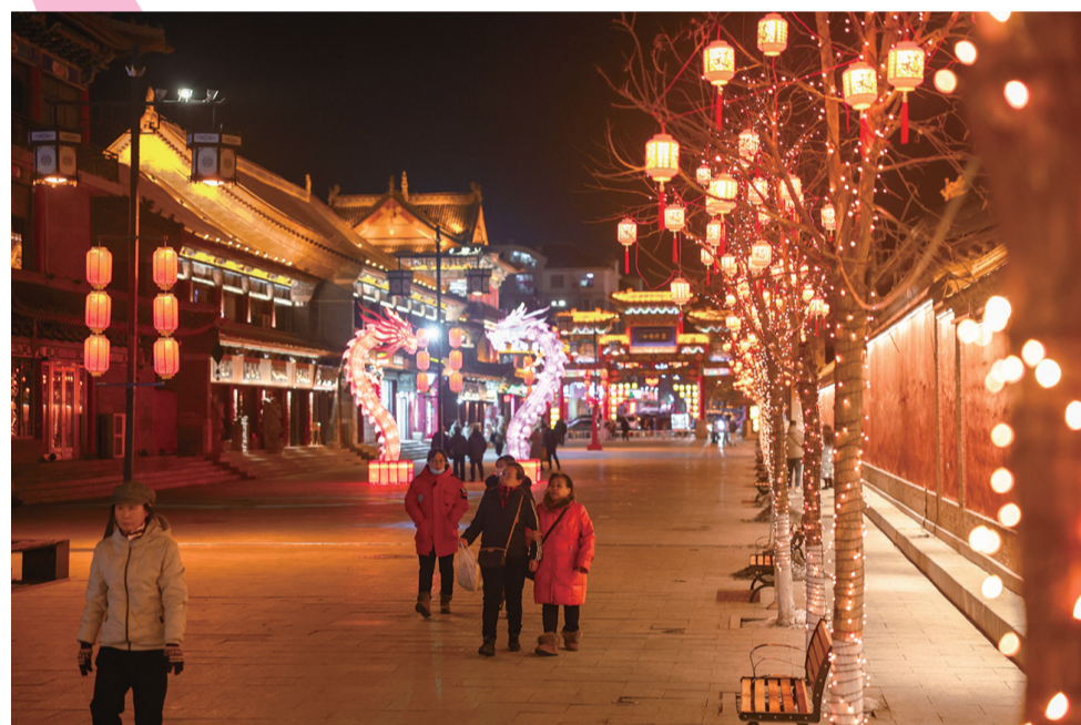
市民到景点打卡拍照