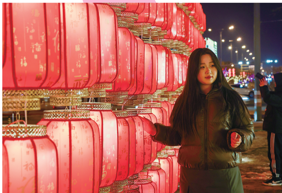
市民在灯笼前拍照留念