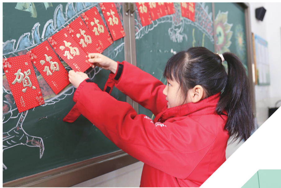
锡林南路小学分校的学生摘“心愿红包”

教育、铸牢中华民族共同体意识，开展主题班会和主题团队日活动。邀请新时代先进人物进校园开展宣讲活动，充分发挥先进人物榜样作用，教育引导广大青少年学习典型、争做先锋。鼓励师生主动分享身边民族团结进步故事，引导师生由衷感恩、听党话、跟党走，不断增强民族团结进步教育实效性。通过一系列主题教育活动的开展，进一步教育引导全市中小学生坚定不移感恩党、听党话、跟党走，培养具有家国情怀、过硬本领、担当民族复兴大任的时代新人。