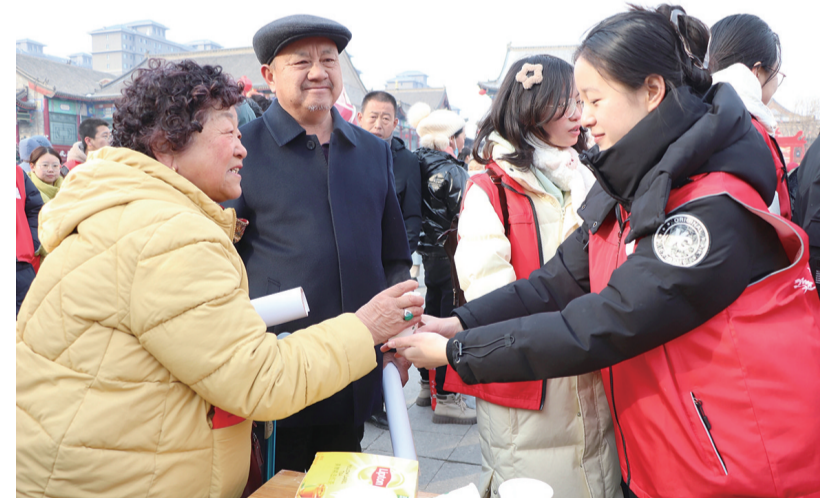
春节期间，玉泉区新时代文明实践中心的志愿服务不打烊，志愿者们坚持在2024呼和浩特新春文化庙会现场为市民游客提供志愿服务，让大家沉浸在浓浓年味的同时，也感受到多种形式的暖心服务。图为志愿者为大家免费送上红糖水、奶茶等饮料。