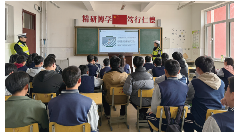
为全力做好春季开学期间道路交通安全管理工作，增强学生交通安全意识和自我安全防范意识，预防和减少涉及学生道路交通事故的发生，2月26日上午，呼和浩特经开区交警大队宣传辅警深入辖区沙尔沁中学开展了“开学第一课”交通安全宣传活动。