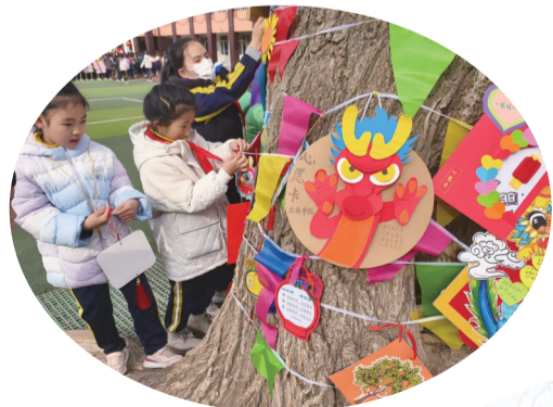
关帝庙街小学的学生将心愿卡挂在树上