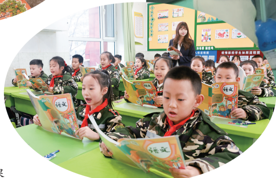
五塔寺东街小学学生上课