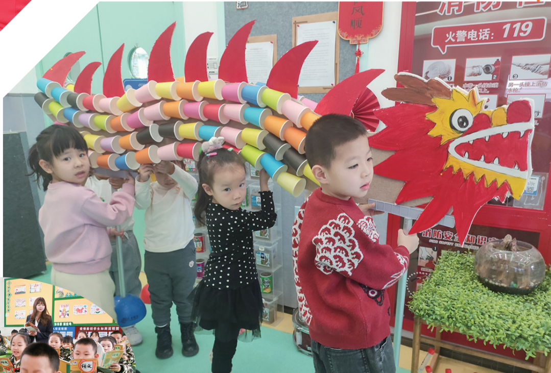
回民区第三幼儿园的小朋友体验舞龙