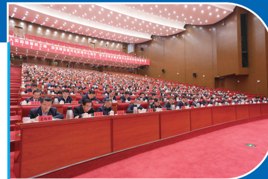
2023年3月11日,全市领导干部学习贯彻习近平新时代中国特色社会主义思想党的二十大精神专题培训班开班。

导干部围绕习近平总书记关于加强和改进民族工作的重要思想、习近平经济思想等专题登台授课。建立完善重大政治理论轮训机制,党校主体班理论课程占比70%、课程年平均更新率达30%以上,各类专题班次均安排习近平总书记关于本行业本领域重要论述解读课程。举办市级理论学习班4期、轮训市管干部1100余名,广泛开展“三懂一会”教育、“七学七新”活动,推动全市上下持续兴起学习贯彻党的创新理论热潮。