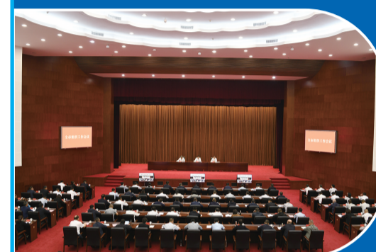
2023年9月18日,全市组织工作会议召开,部署全市党的建设和组织工作。