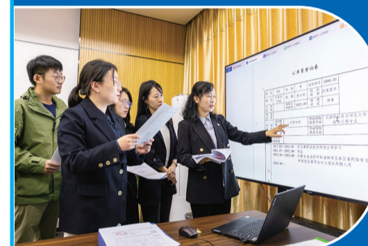
市委组织部在玉泉区进行公务员登记“上门”审核,讲解申报所需材料注意事项并解答相关政策问题。