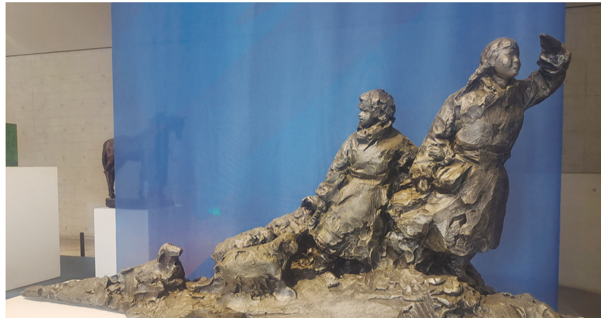
青铜雕塑《草原英雄小妹妹》