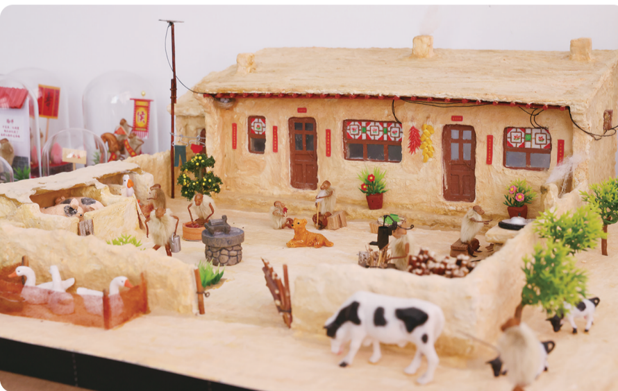
毛猴手工艺品展示