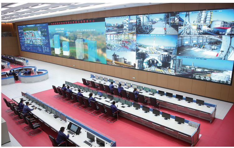
旭阳集团呼和浩特园区智慧管理中心

如今，首府聚焦建设区域金融中心、引领和带动全区金融高质量发展的定位，紧盯科技创新、绿色发展以及传统产业转型升级、未来产业布局加大金融支持力度，加快培育优质企业上市，为发展新质生产力注入金融动能。