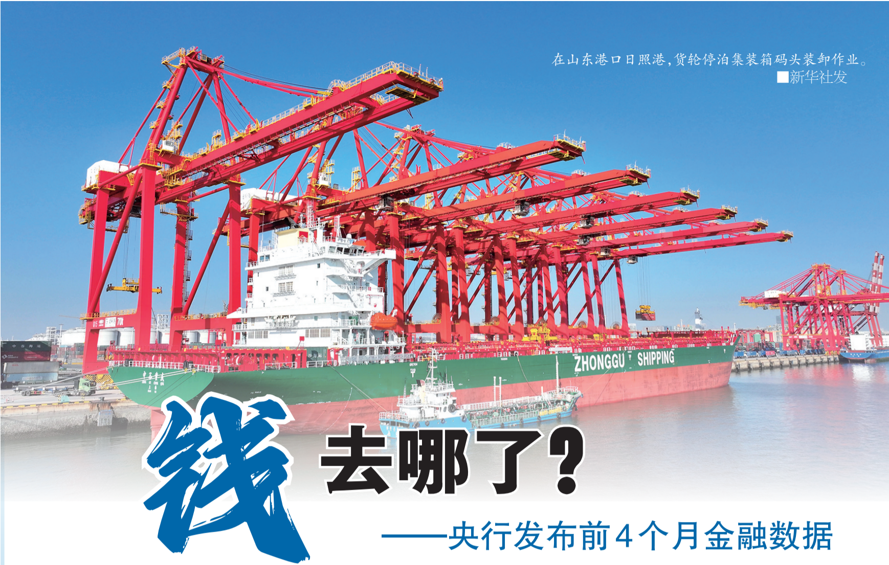
在山东港口日照港,货轮停泊集装箱码头装卸作业。 ■新华社发