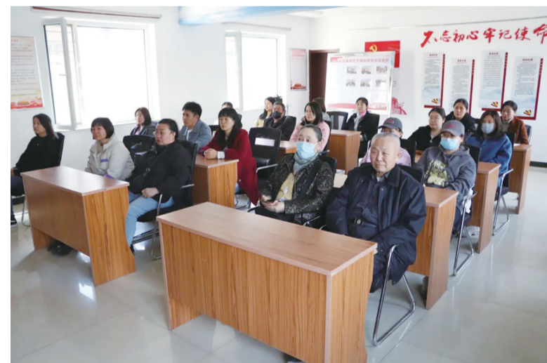
近日,玉泉区“感党恩、听党话、跟党走”主题宣讲走进富丽社区。玉泉区“青城之光”宣讲团成员围绕“六句话的事实和道理”“铸牢中华民族共同体意识”等内容,向富丽社区的干部群众作了深入浅出的讲解,让大家受益匪浅。