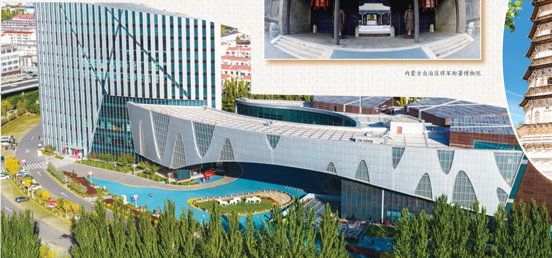
内蒙古自治区将军衙署博物院