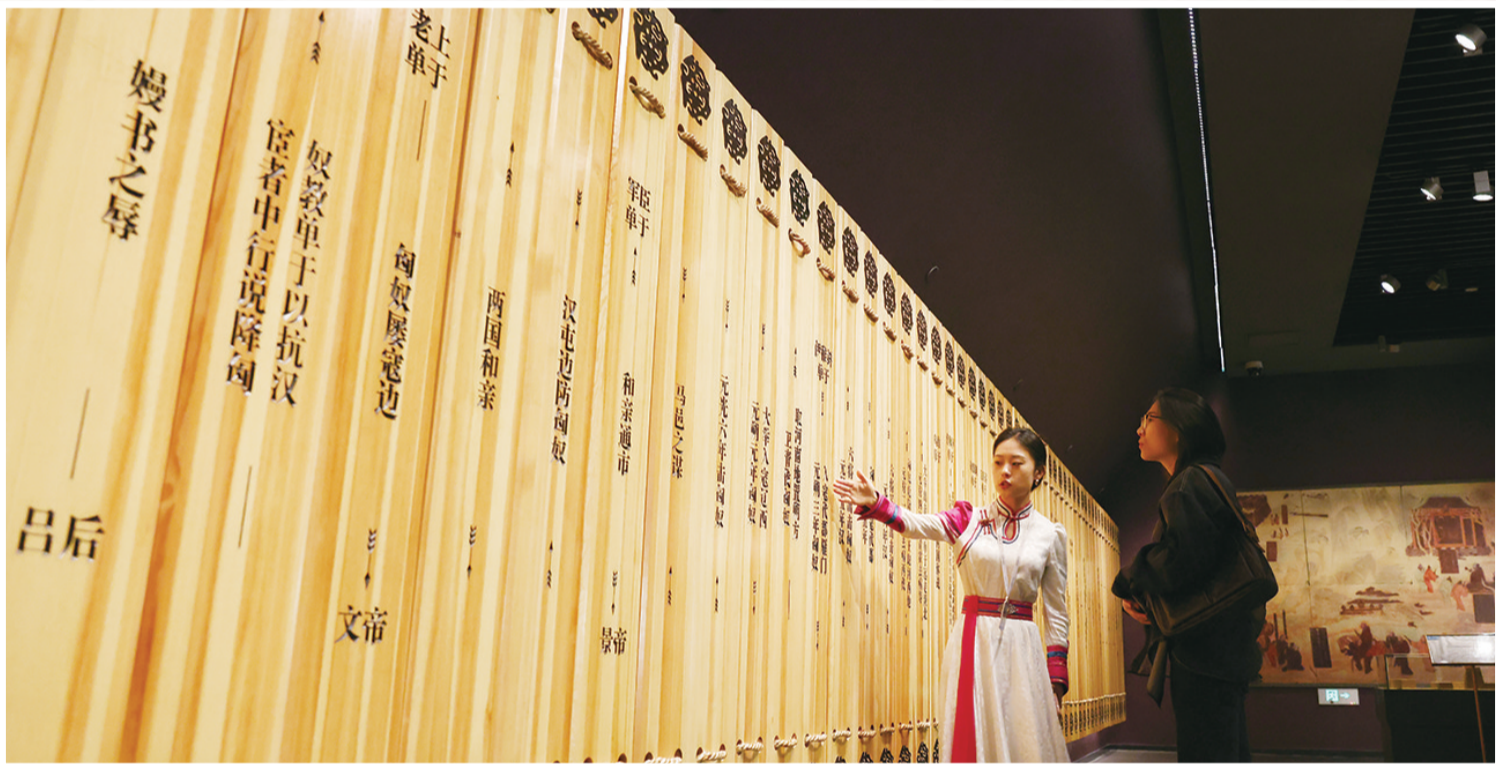
昭君博物院社教员向游客讲解汉匈长达170多年的关系图