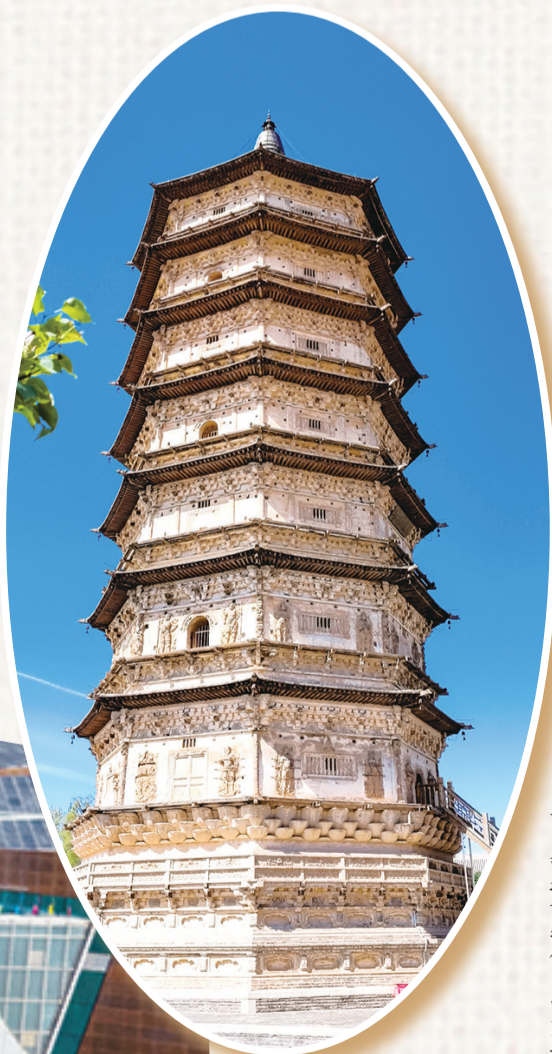
丰州古城博物馆内的万部华严经塔