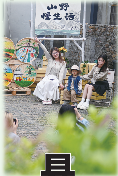
游客在浙江省桐庐县富春江镇荪村游玩