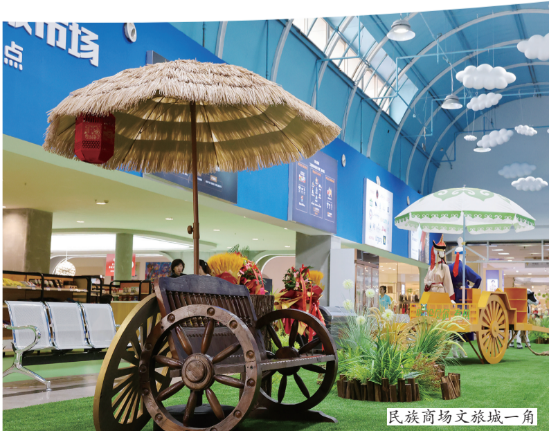
民族商场文旅城一角

如星海海中华优秀传统文化让人着迷，非遗文化与旅游、商业结合的发展路子，也让传统文化以更有生命力的形式进行着传承。市非物质文化遗产促进会会长贾宏伟表示：“非遗是凝聚中华各民族人心的精神纽带，又是推进社会发展、提高人民生活福祉的重要资源。通过广泛开展非物质文化遗产展示、展演、宣传、传播、文旅融合等活动，可以传承和弘扬优秀传统文化，进一步增进文化自信，铸牢中华民族共同体意识。”