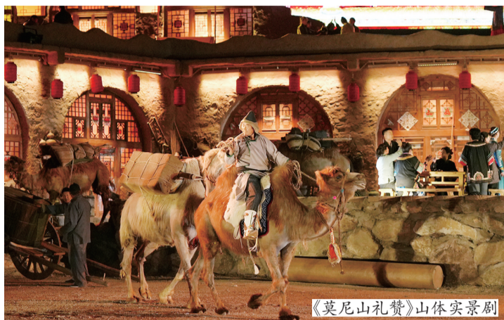
《莫尼山礼赞》山体实景剧