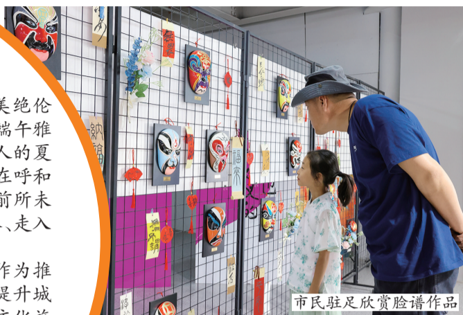
市民驻足欣赏脸谱作品

近年来，我市把文化与旅游融合发展作为推进经济高质量发展的一项重要举措，有效提升城市文化能级、提高首府旅游文化内涵，整合文化旅游资源，推出文化旅游精品，打造文化旅游品牌，让文化“血脉”更畅通，让文化建设有形有感，城市的每个角落都散发出令人向往的精神气质。