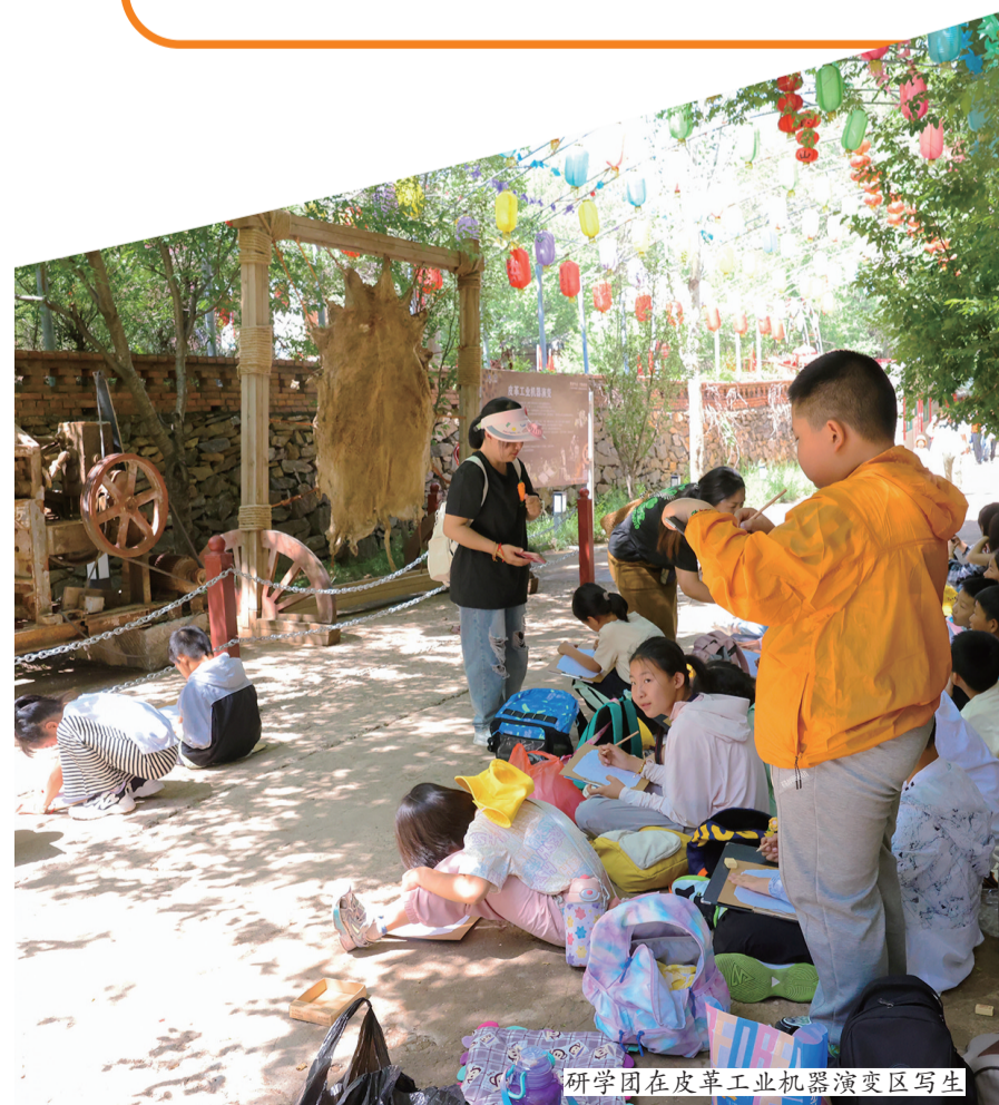
研学团在皮革工业机器演变区写生