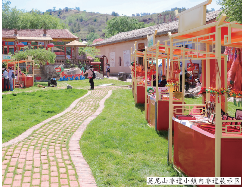
莫尼山非遗小镇内非遗展示区