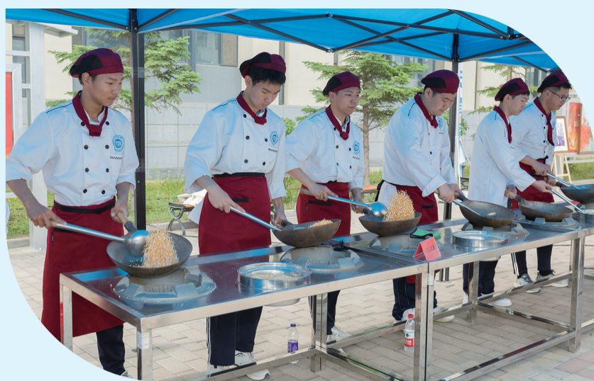
烹饪专业学生展示勺工基本功