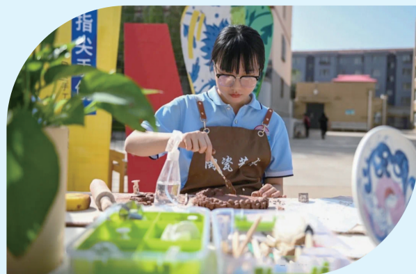
学生陶瓷艺术技能展示