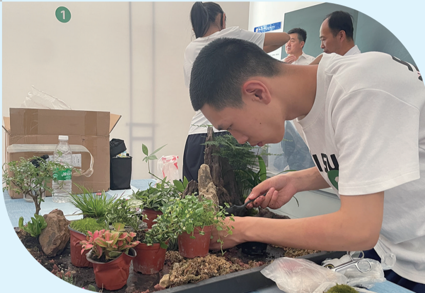
园林微观设计与制作比赛

本报讯(实习记者 若谷)近年来,呼和浩特市始终把教育作为提高群众幸福指数的重要抓手,围绕“首学城市”建设目标,高位推进,优化整合职教资源,持续深化产教融合,贯通人才成长路径,努力开拓创新,以坚定的信心、有力的举措、明确的目标昂首阔步奋力迈上职业教育高质量发展新征程。