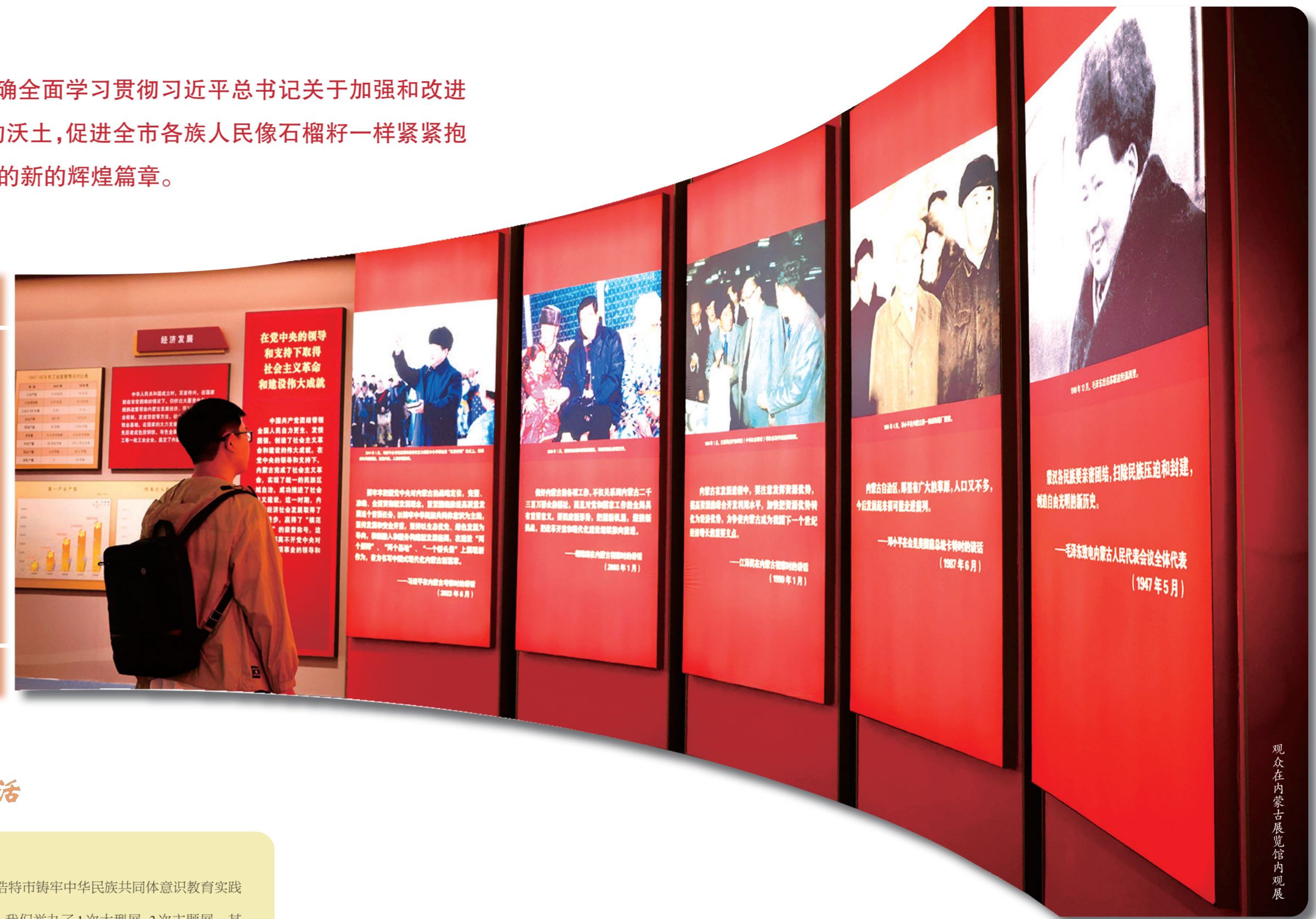
观众在内蒙古展览馆内观展。