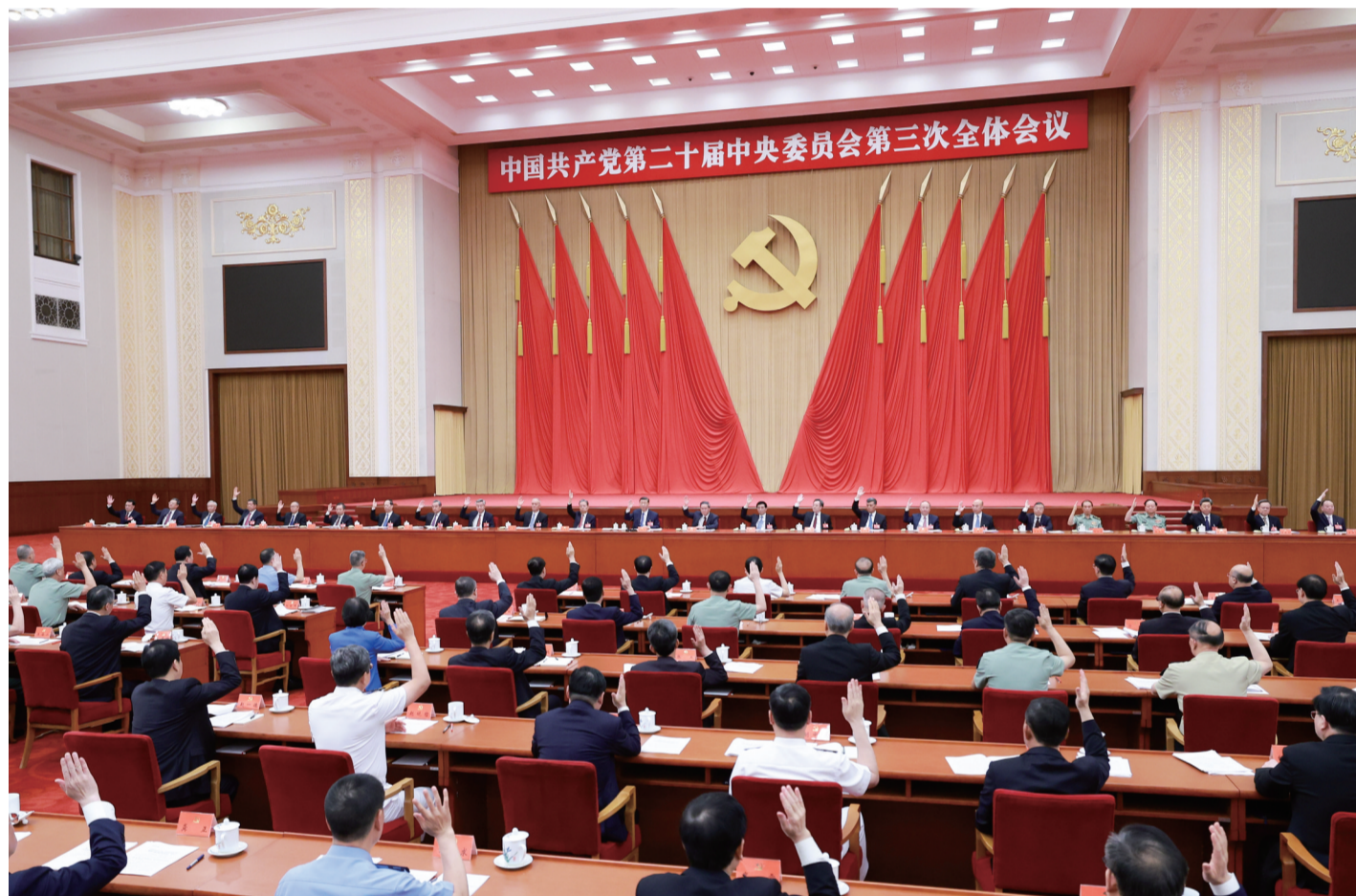
中国共产党第二十届中央委员会第三次全体会议,于2024年7月15日至18日在北京举行。中央政治局主持会议。