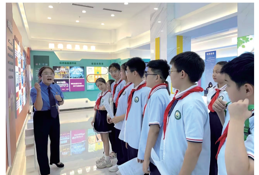
近日,敕勒川绿地小学五(8)中队的师生走进呼和浩特市检察院,开展了“快乐过暑假 法治伴我行”——法治教育实践活动。

大赛共评出金奖92项、银奖180项、铜奖727项。内蒙古工业大学、内蒙古机电职业技术学院分别以团体总分第一名的成绩荣获赛事最高荣誉“挑战杯”。内蒙古科技大学、内蒙古师范大学、内蒙古建筑职业技术学院、内蒙古化工职业学院获得“优胜杯”。