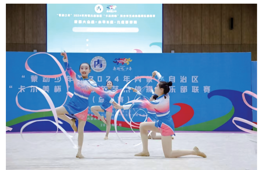
近日,“蒙动少年”2024年内蒙古自治区“卡尔美杯”青少年艺术体操俱乐部联赛在呼和浩特市举办。