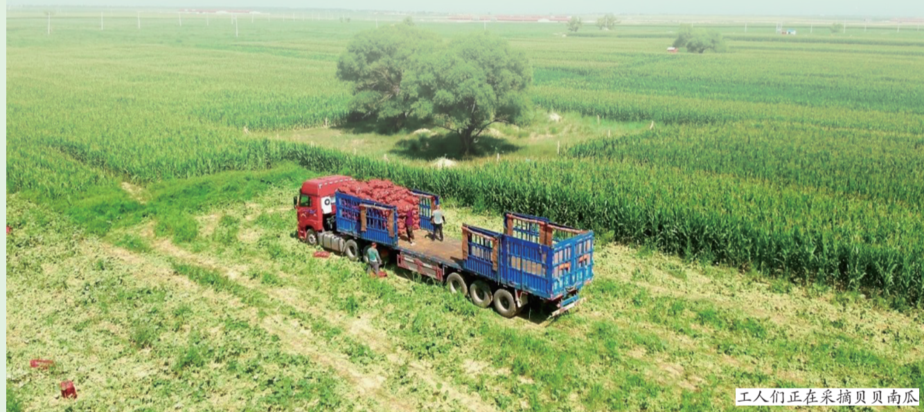
工人们正在采摘贝贝南瓜

近日,记者走进和林格尔县舍必崖乡同昌营村贝贝南瓜种植基地,看到工人们正在热火朝天地采摘贝贝南瓜,装袋、搬运、装车,一派繁忙的丰收景象。