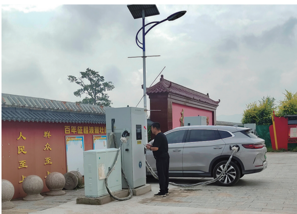
村民正在使用充电桩给新能源汽车充电

本报讯(记者 武子暄 通讯员 查新娜)走进赛罕区榆林镇苏木沁村,一排崭新的充电桩矗立在村委会停车场。