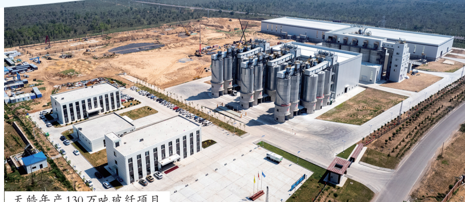
天皓年产130万吨玻纤项目