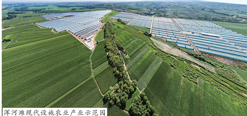
浑河滩现代设施农业产业园