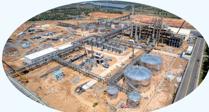
旭阳中燃30万吨/年炭基新材料项目

清水河经济开发区特勤消防站项目的投入使用，将切实为园区消防安全、增强抗御火灾和快速处置突发事件能力奠定了坚实的基础，也为企业经营生产、安全发展营造了良好氛围，营商环境建设取得显著成效。