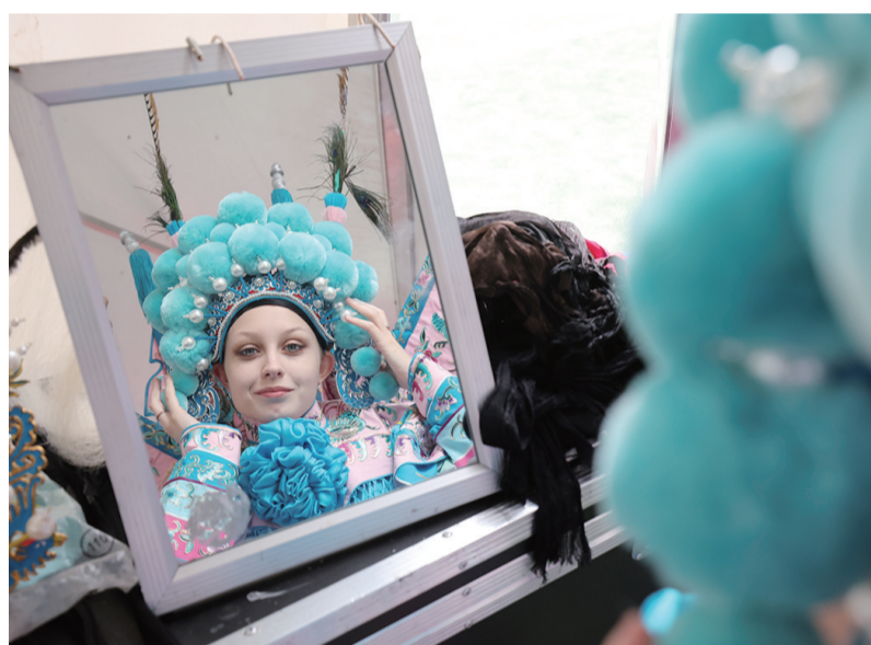
沉浸式体验京剧魅力