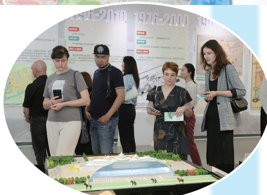
了解呼和浩特的城市规划