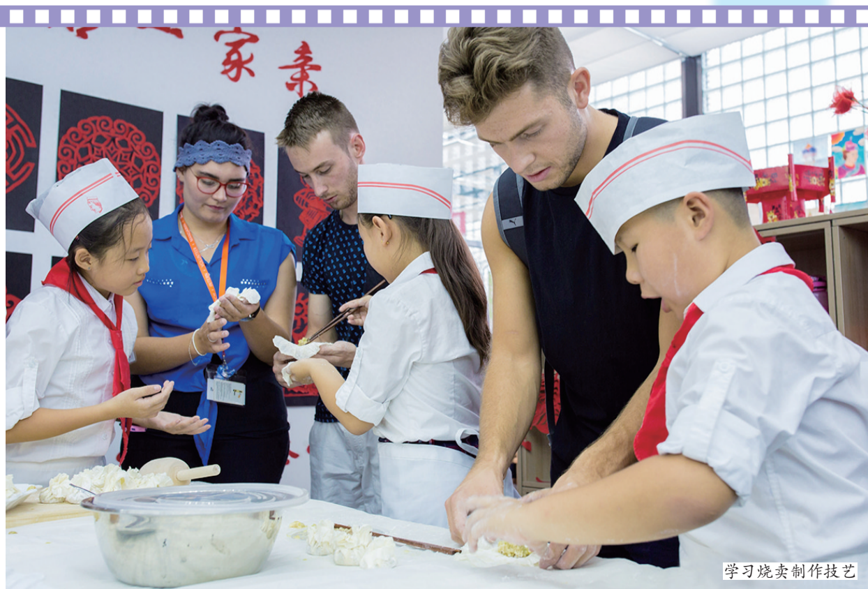
学习烧卖制作技艺