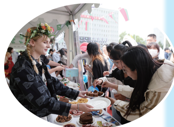
留学生向同学们推荐家乡美食