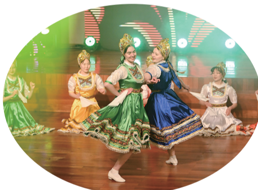
外国友人在呼和浩特载歌载舞