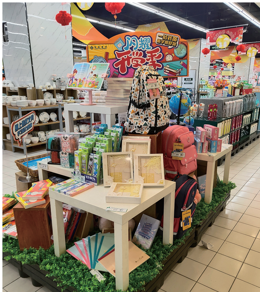
超市内文具成为热销商品

业内人士表示,“开学经济”的繁荣是社会经济发展的一个缩影,消费者在购买时更趋于理性消费,注重品质与实用性,这种理性消费观念不仅有助于培养学生们良好的消费习惯,也为市场健康发展注入了新的活力。