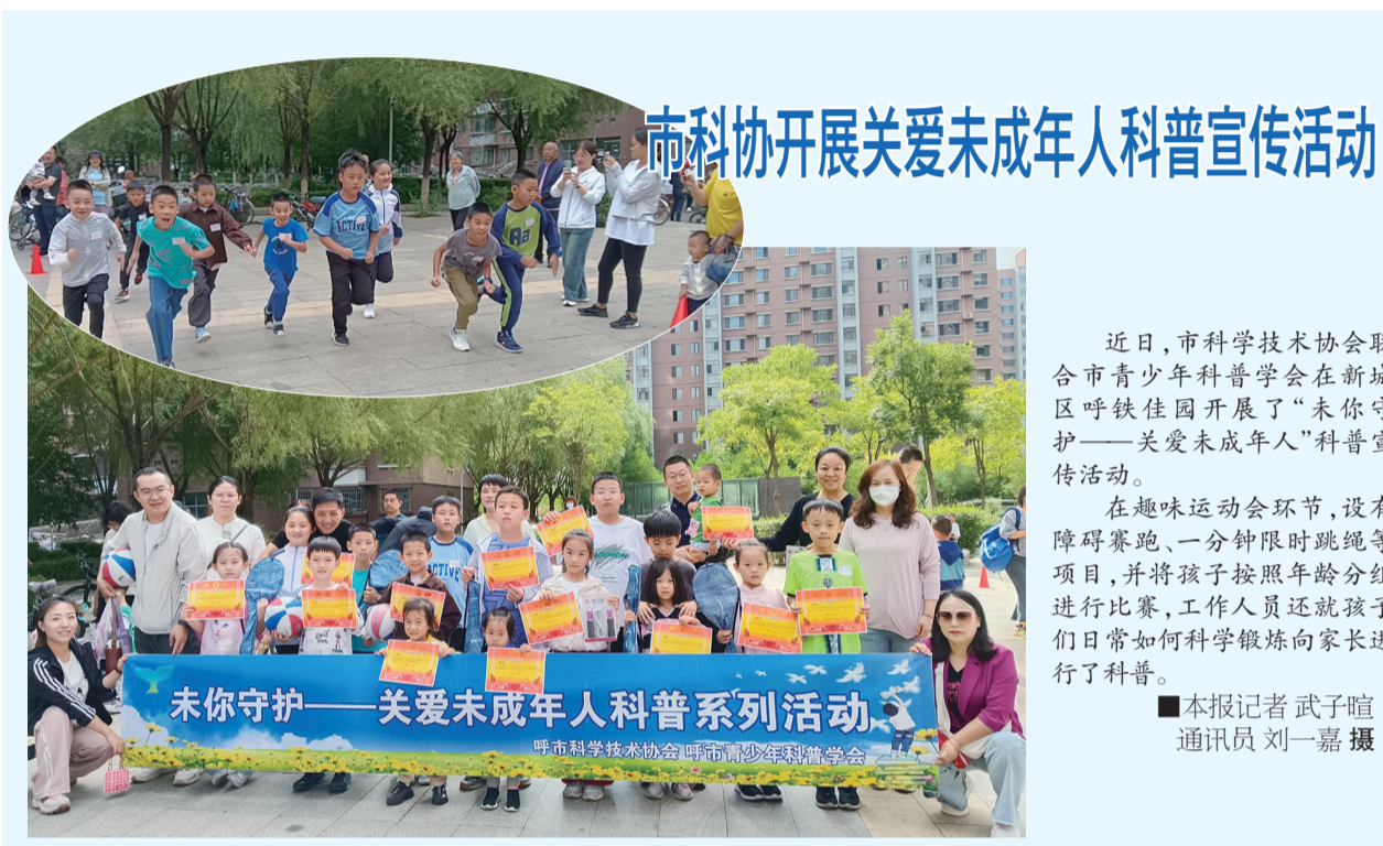
市科协开展关爱未成年人科普宣传活动

笑脸表情，课堂上一片欢声笑语。通过开展“开学心理健康周”活动，东风路小学不仅营造了积极向上、健康和谐的校园氛围，也让每一个孩子都能在校园度过快乐的学习生活时光。