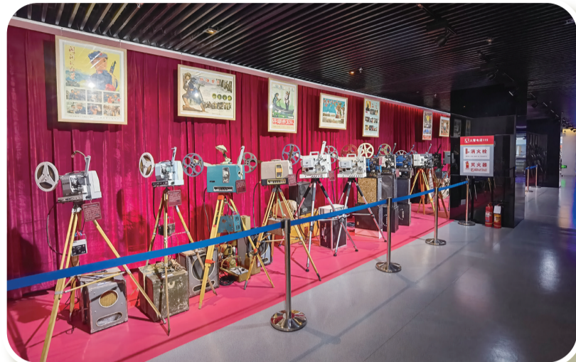
中国电影展区展出的电影放映机

百余年来,电影经历了从无声到有声、从黑白到彩色、从窄银幕到宽银幕、从胶片到数字、从单一化到多元化的发展历程,历经风雨而茁壮成长。内蒙古电影博物馆呈现给我们的精彩而生动的内容,是内蒙古乃至中国电影发展的真实写照,更是波澜壮阔的百年电影发展史的一道缩影。透过这一张张泛黄的老照片,一件件鲜活的文物,一幕幕曾经在心底掀起过波澜的老影像,无不唤醒人们深埋心底、永生难忘的观影记忆!