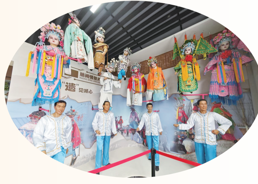
本版编辑:李慧平 阿荣娜 美编:辛杰