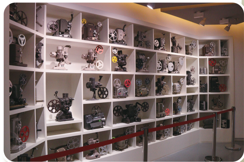
馆内收藏的各式胶片电影放映机