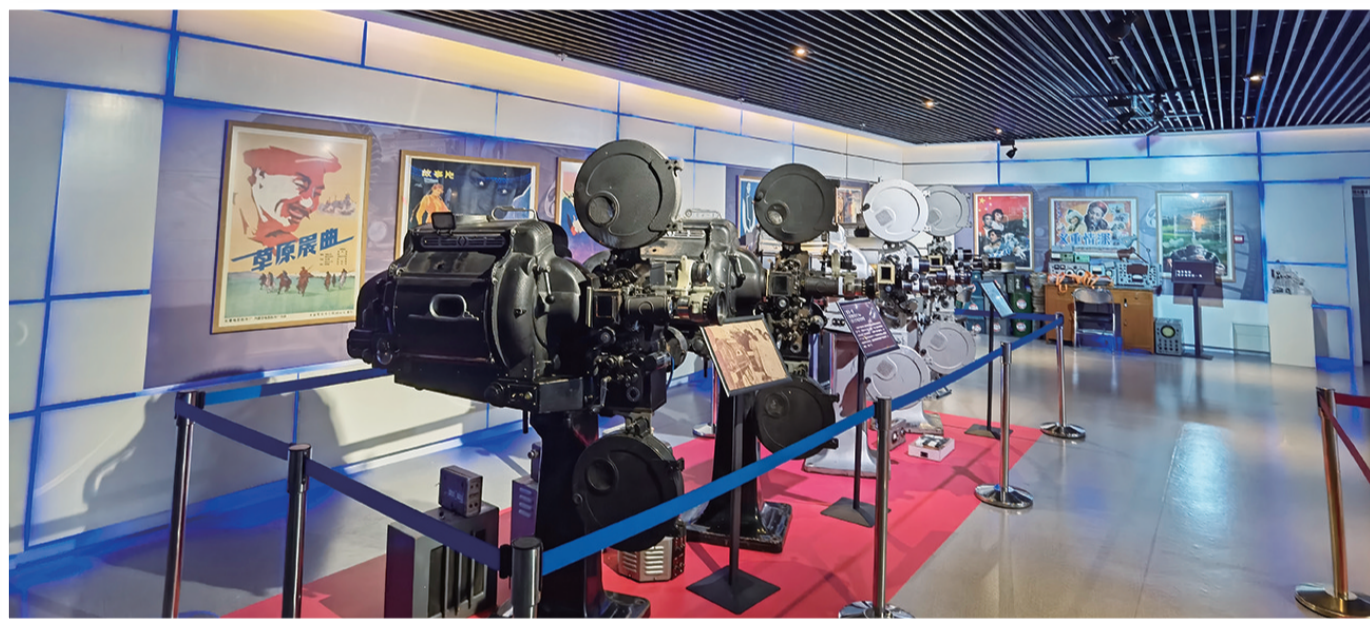
解放-1型破棒棒弧光35mm固定式电影放映机