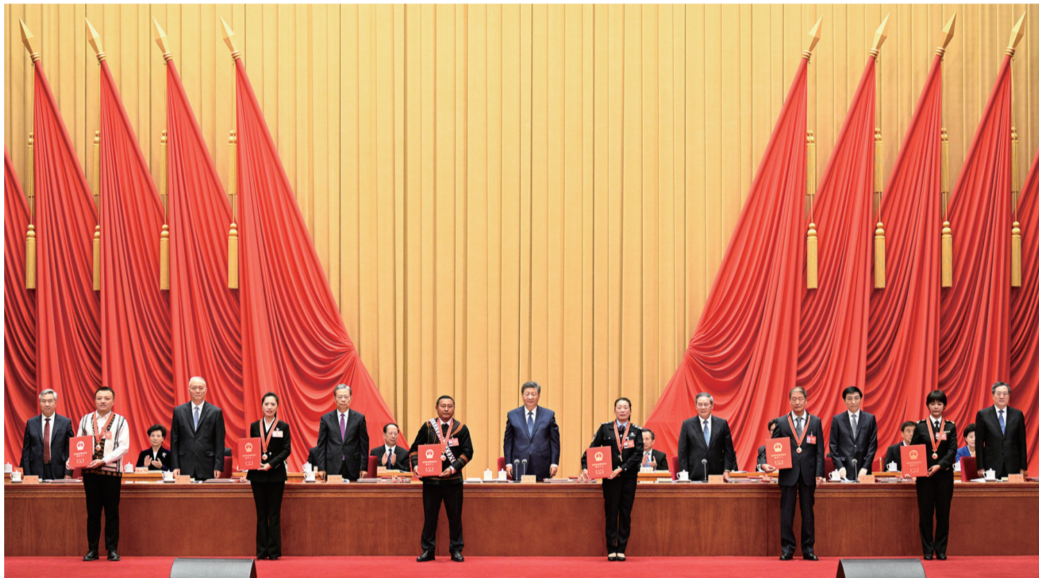
9月27日,全国民族团结进步表彰大会在北京举行。这是习近平等为受表彰的模范个人和模范集体代表颁奖。

新华社北京9月27日电 全国民族团结进步表彰大会27日上午在北京举行。中共中央总书记、国家主席、中央军委主席习近平出席大会并发表重要讲话。他强调,要全面贯彻新时代中国特色社会主义思想特别是党关于加强和改进民族工作的重要思想,坚持以铸牢中华民族共同体意识为主线,不断推进民族团结进步事业,推动新时代党的民族工作高质量发展,推进中华民族共同体建设,为以中国式现代化全面推进强国建设、民族复兴伟业而不懈奋斗。