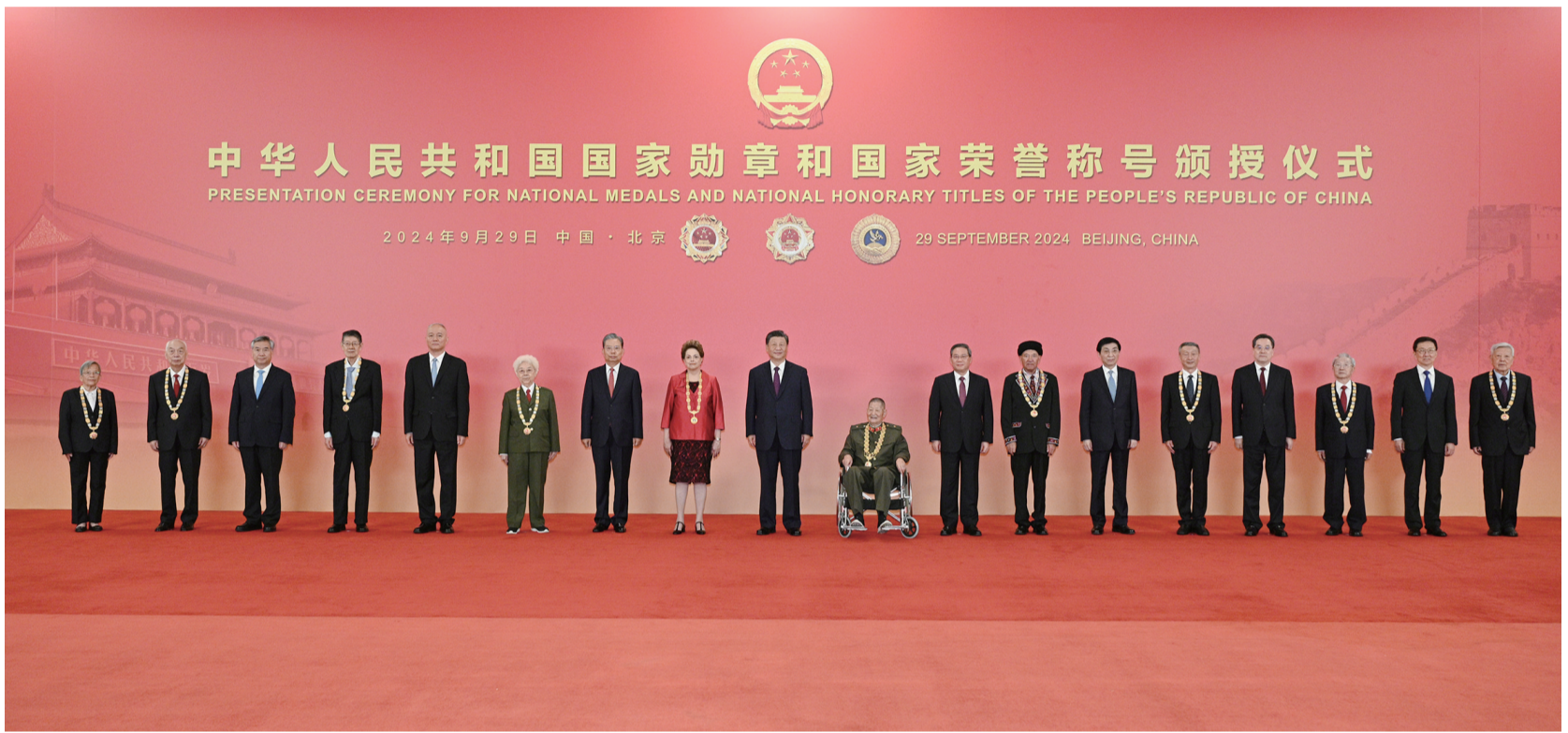
9月29日,中华人民共和国国家勋章和国家荣誉称号颁授仪式在北京人民大会堂金色大厅隆重举行。习近平等领导同志同国家勋章和国家荣誉称号获得者合影留念。

新华社北京9月29日电 中华人民共和国国家勋章和国家荣誉称号颁授仪式29日上午在北京人民大会堂金色大厅隆重举行。中共中央总书记、国家主席、中央军委主席习近平向国家勋章和国家荣誉称号获得者颁授勋章奖章并发表重要讲话。习近平强调,伟大时代呼唤英雄、造就英雄。英雄辈出,党和人民事业就会兴旺发达、长盛不衰。各级党委和政府要关心关爱英雄模范,推动全社会尊崇英雄、学习英雄、争做英雄。希望受到表彰的同志珍惜荣誉、再接再厉,争取更大光荣。 李强、赵乐际、王沪宁、丁薛祥、李希、韩正出席颁授仪式,蔡奇主持。 9时许,国家勋章和国家荣誉称号获得者集体乘坐礼宾车从驻地出发,由