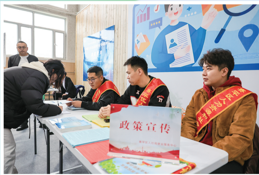
为前来应聘学子提供指导帮助