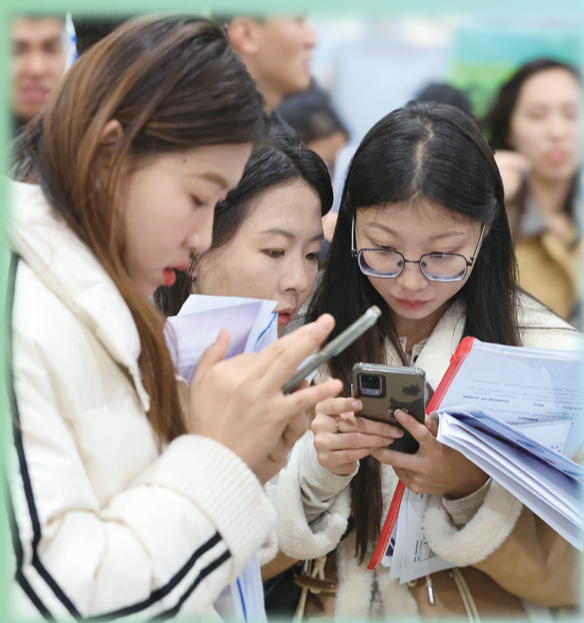
同学之间交流招聘信息