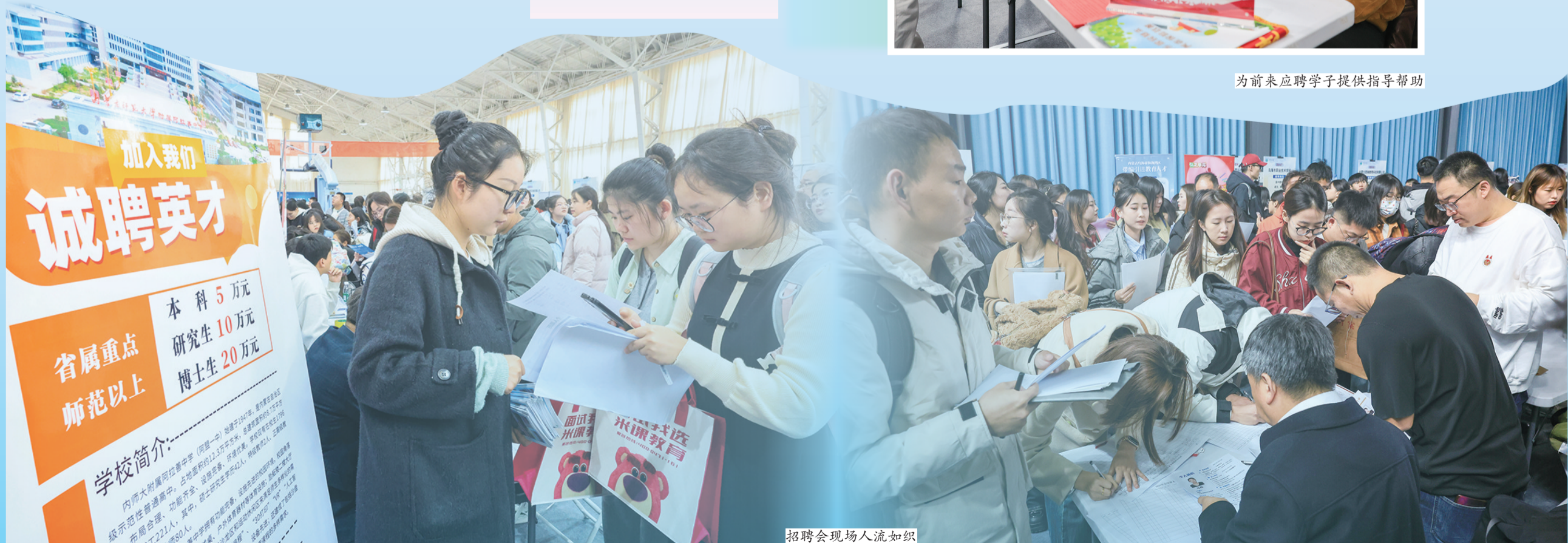
招聘会现场人流如织