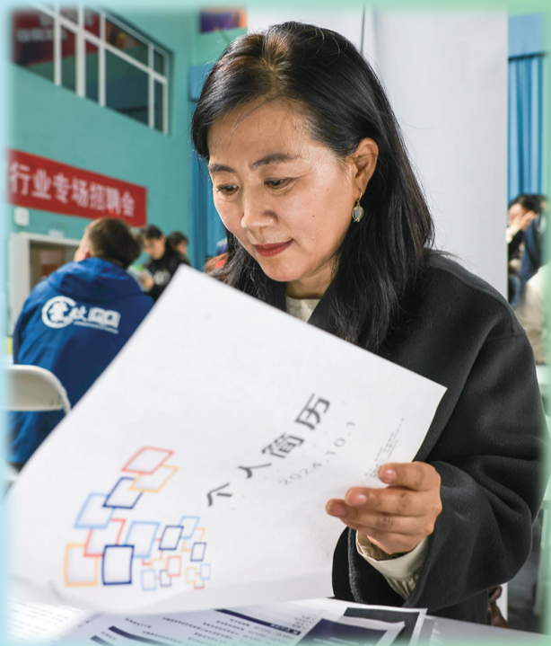
用人单位工作人员翻阅求职者简历