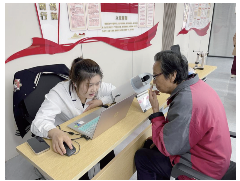
近日,新华社区新时代文明实践站联合朝聚眼科医院开展义诊活动。