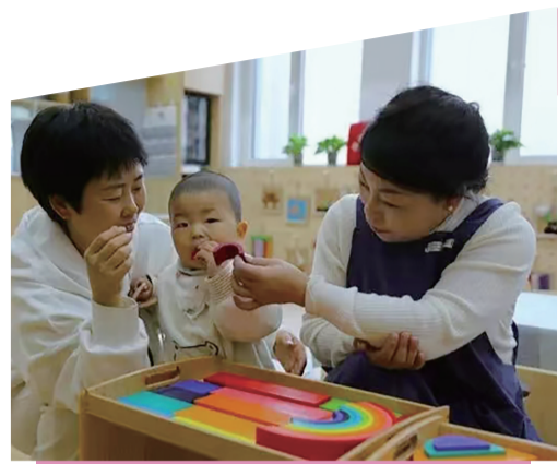
▲托育机构工作人员陪小朋友玩耍 ▼社区工作人员入户供暖