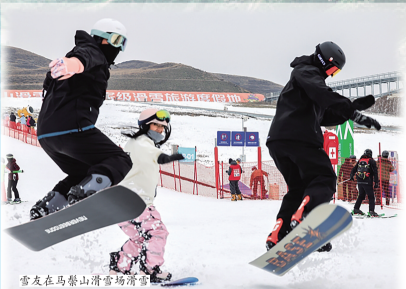
雪友在马鞍山滑雪场滑雪

假如有一天,你来到呼和浩特市,会把哪儿当作你旅行的第一站呢?是品尝喷香四溢的烧麦,还是策马驰骋在敕勒川草原,抑或是走进文博场馆寻访城市的文化气质。其实,不管选择去哪儿,拥有2400多年建城史的呼和浩特市都不会让你失望,文博场馆延迟闭馆、夜间开放,大型演唱会期间的志愿者服务,马鞍山滑雪场针对全国大学生的免票政策……这些暖心之举,为呼和浩特市的城市吸引力加码,欢迎你来这个冬季来到青城,感受北疆的冰雪与浪漫。