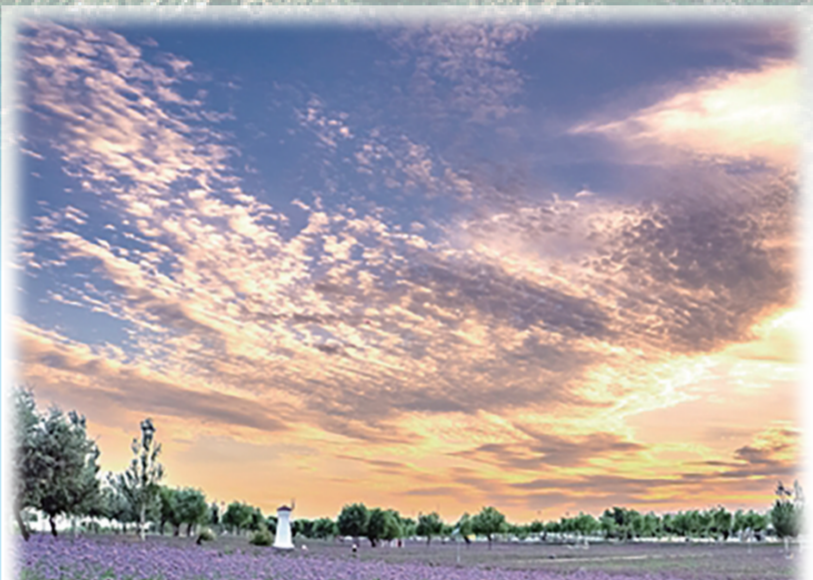
大黑河郊野公园花田

黄河之水天上来,一泻奔涌而至,润泽大地造福万物,呼和浩特市就处在黄河优美的“几字弯”上。 万里长城万里长,内蒙古境内现存长城7500多公里,总长度占全国长城资源总量的三分之一。呼和浩特市境内共有历代长城657.97公里,单体建筑及相关遗存1096余处。“新城区、回民区、赛罕区、土默特左旗、武川县、和林格尔县及清水河县都有长城遗存,跨越了战国、秦、汉、北魏、金、明6个历史时期。”呼和浩特市长城科普学会会长高晓梅说。 今年,伴随着《再见爱人》《山水间的家》等多档热门综艺节目在呼和浩特市清水河县老牛湾黄河大峡谷旅游区进行录制,黄河与长城相手的绝美景观终于藏不住了。 “看节目里的嘉宾吃的熏鸡好美味呀,那一站的录制地点就是呼和浩特市!”“嘉宾们还品尝了呼和浩特的‘冻果’,清水河县的海红果总算是‘出圈’了!”“奔着草原、骏马来的呼和浩特市,没想到被老牛湾圈了粉。”今年夏天,来到清水河县老牛湾黄河大峡谷旅游区的外地游客罗女士忍不住赞叹,尤其是她所住的被网友称为“建在悬崖边的民宿”,站在露台上就能饱览老牛湾的风景。罗女士说:“在大自然的鬼斧神工面前,所有的负面情绪似乎都是小事,那种放松和顿悟的感觉让我此生难忘。” 依山傍水的清水河县,还蕴藏着一项传承800余年的自治区级非物质文化遗产代表性项目——清水河窑瓷,老牛湾黄河大峡谷旅游区为了提升游客的体验感,推出了非遗制作体验活动,绝美的风光也吸引了书画爱好者到此写生,在得到App创始人罗振宇的直播间里,呼和浩特市美术馆(书画院)的书画家们就用画笔记录下了长城、黄河、蜿蜒的道路,尽览眼底的黄河风光,成就了一场精彩的内蒙古老牛湾超马赛,越野跑爱好者在这里挥洒汗水,挑战极限,欣赏美景…… 在综艺节目的流量下,还带火了黄河炖鱼,这道菜最正宗的制作地点,就在黄河中上游的分界线——托克托县。黄河岸边的郝家窑村,有多家以黄河炖鱼为招牌菜的农家乐,这道菜的特点就是用托克托县的特产辣椒和茴香,与黄河鱼碰撞出独一无二的气味。每年春天都会举办的托克托县黄河开河节,到2024年已经连续举办5届,2024年的万人品尝炖鱼活动,更是极大地带动了市民、游客对此观光旅游。 今年10月2日,好汉汉山明长城国家文化公园正式开园。10月初,距离呼和浩特市泰长城3公里的呼和浩特长城文化博物馆开始试运营。在户外,游客可以探访长城遗址,感受历史的痕迹;在场馆,也可以欣赏文物展品,感受长城文化、北疆文化。