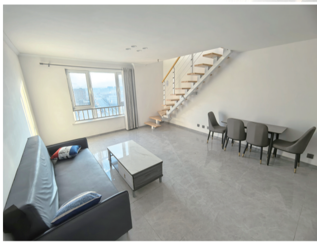
保障性租赁住房赛罕区彩虹城玖都公馆项目