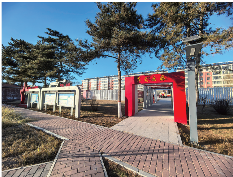
改造后的新城区八一小区