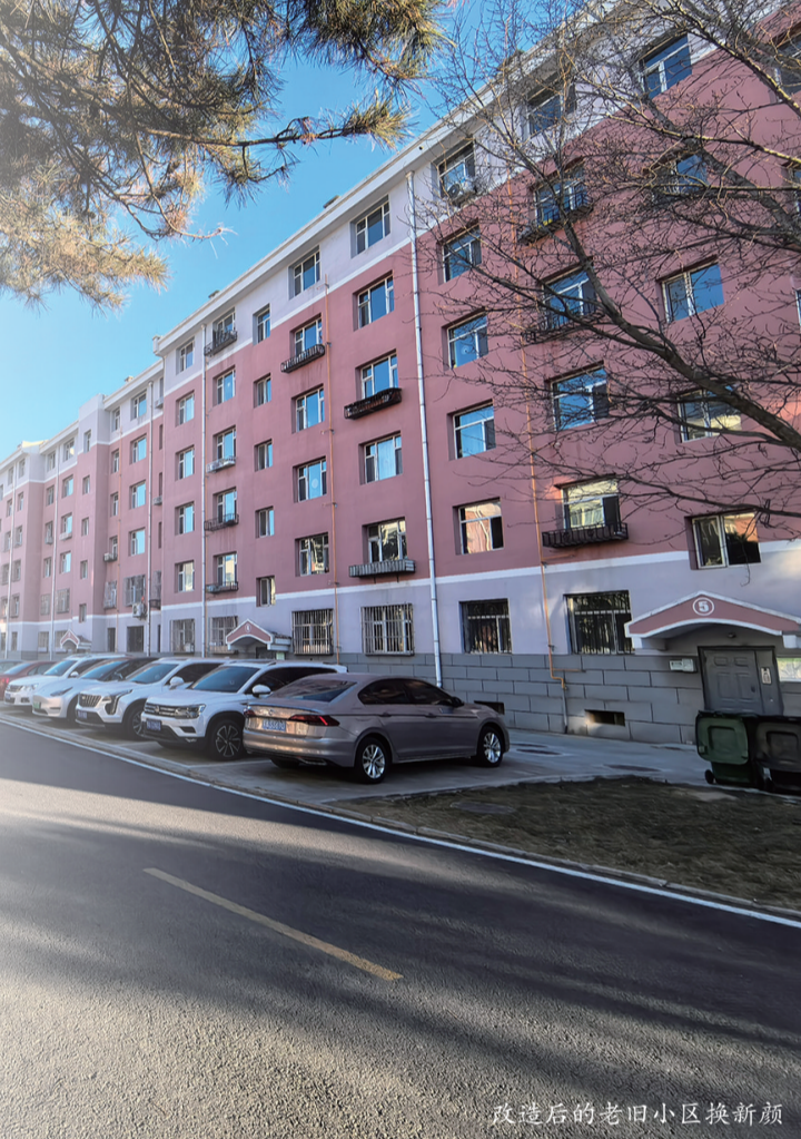
改造后的老旧小区换新颜