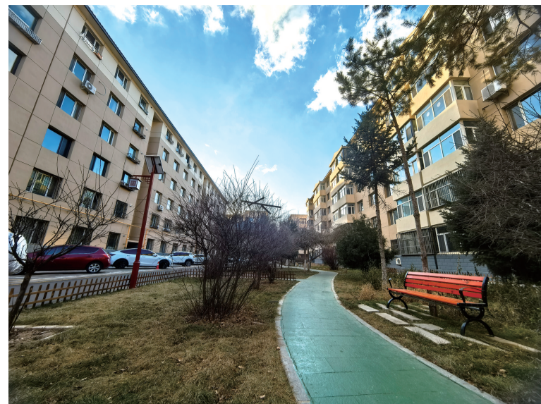
改造后的玉泉区绿苑小区