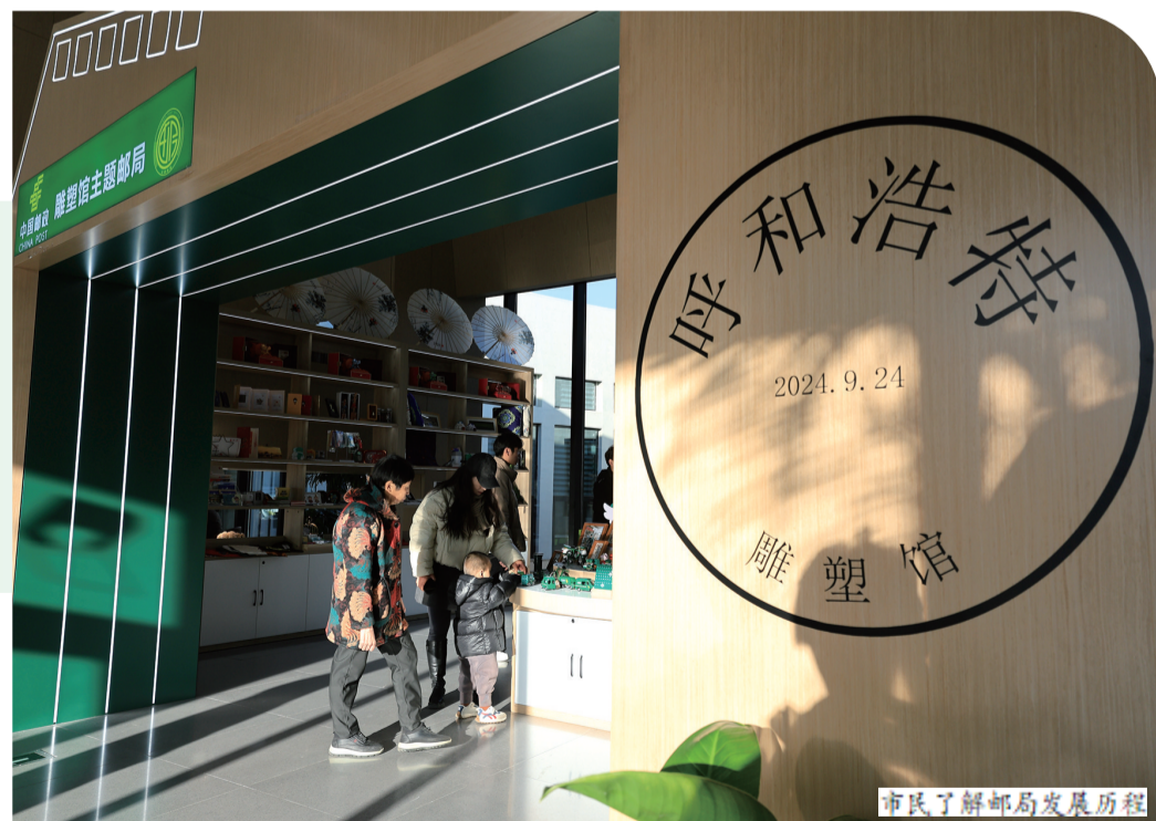
市民了解邮局发展历程

呼和浩特雕塑馆主题邮局分为乡村振兴区、党报党刊区、集邮区、文创区,市民和游客到此可以欣赏和购买独具特色的文创产品、旅游明信片 and 邮票,并加盖景区纪念邮戳等,因而一经启用便受到市民、游客热捧。