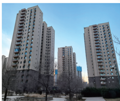
赛罕区阳光美居公租房小区