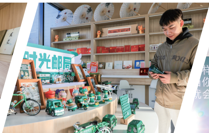
游客了解文创产品