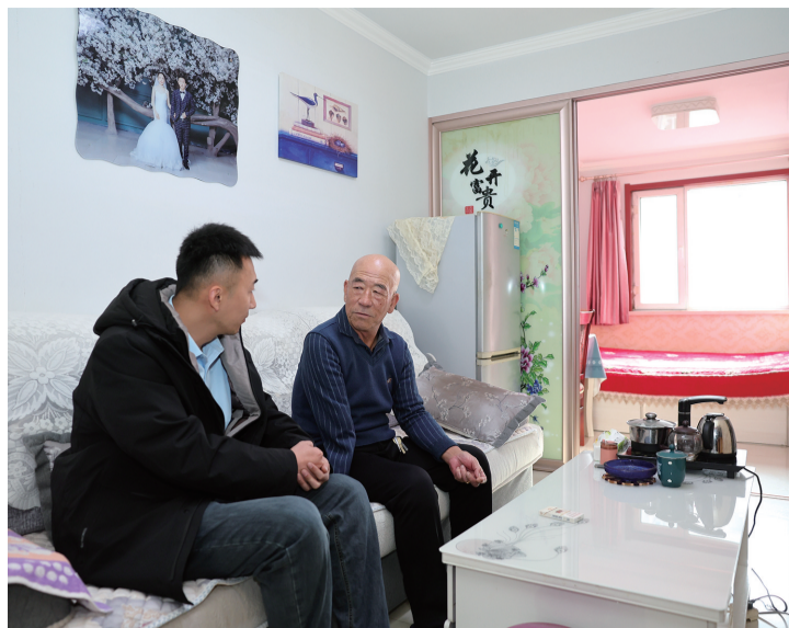
新城区塞外安居公租房小区物业工作人员入户走访