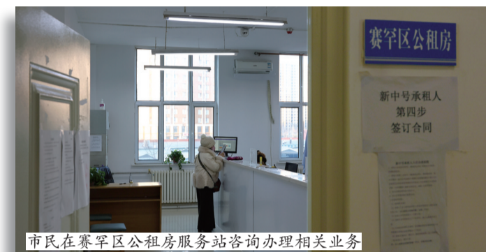
市民在赛罕区公租房服务站咨询办理相关业务

住房条件的不断改善,不仅提升了群众的幸福感和获得感,更折射出了社会的进步。为了让群众安居乐业,呼和浩特市2010年启动公租房建设,2011年启动老旧小区改造,2022年又推出针对留呼大学生的保障性租赁住房……从全方位、多举措解决群众住房难题,全力打造宜居环境,切实让群众住得舒心、住得满意。从“有居”到“优居”再到“宜居”,一字之变,让越来越多的青城人实现安居,拥有了稳稳的幸福。