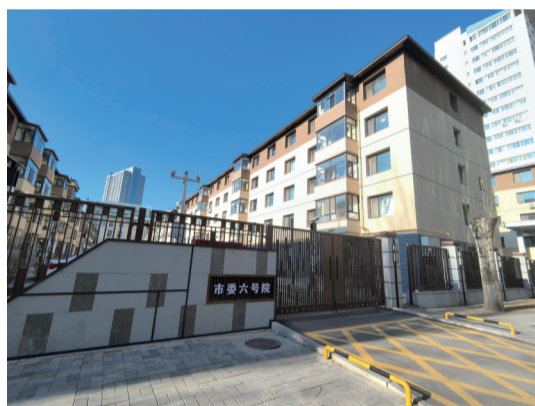
改造后的回民区市委六号院

住房条件的不断改善,不仅提升了群众的幸福感和获得感,更折射出了社会的进步。为了让群众安居乐业,呼和浩特市2010年启动公租房建设,2011年启动老旧小区改造,2022年又推出针对留呼大学生的保障性租赁住房……从全方位、多举措解决群众住房难题,全力打造宜居环境,切实让群众住得舒心、住得满意。从“有居”到“优居”再到“宜居”,一字之变,让越来越多的青城人实现安居,拥有了稳稳的幸福。