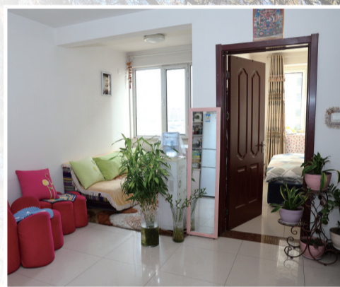
玉泉区康居家园公租房小区住户室内