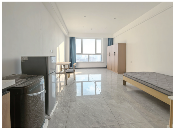
保障性租赁住房赛罕区旺第嘉华项目内景