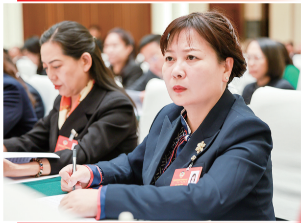
认真听取常委会工作报告