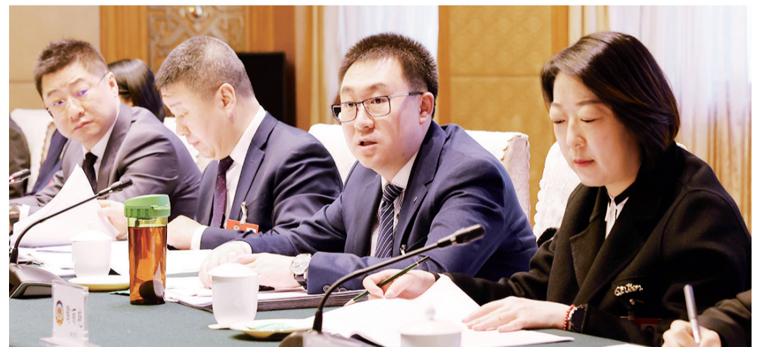
讨论政府工作报告