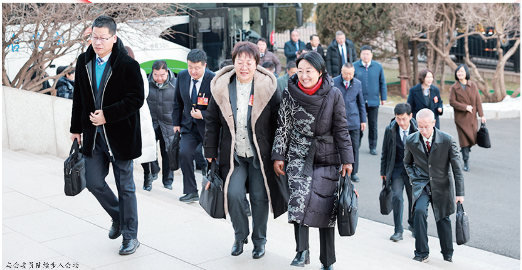
与会委员陆续步入会场