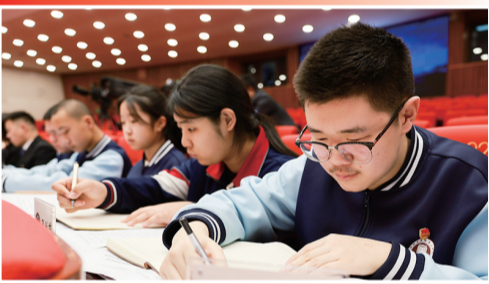
6名学生列席会议,认真记录