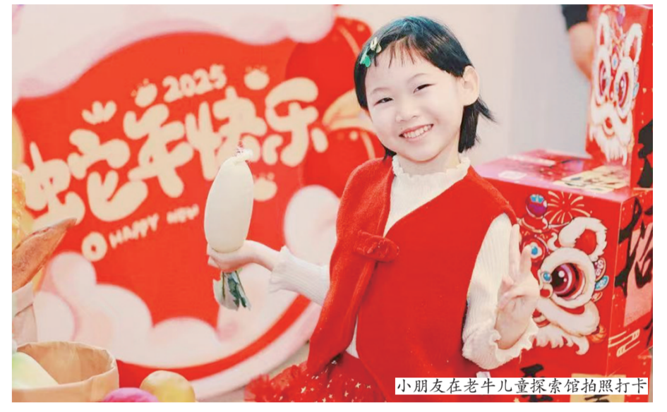
小朋友在老牛儿童探索馆拍照打卡