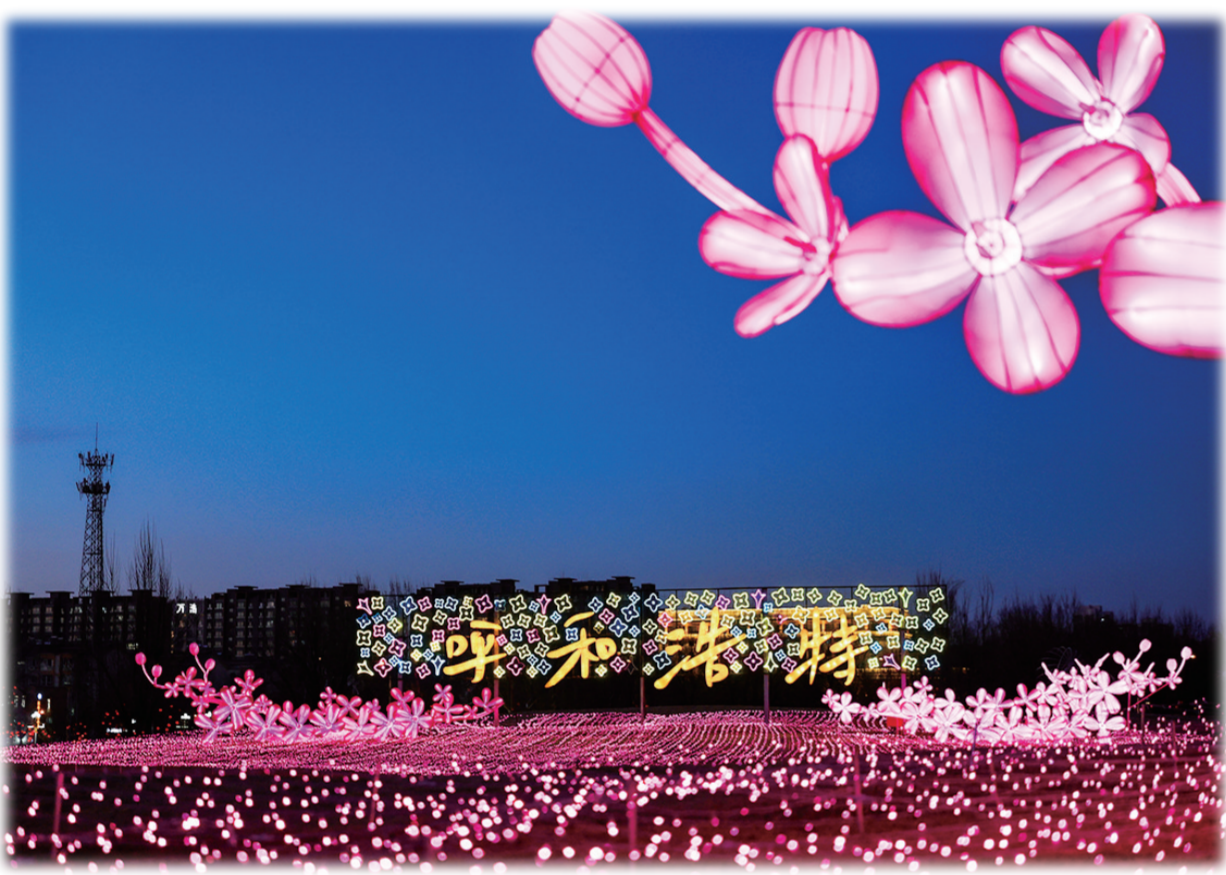
彩灯绽放 祝福弥漫

在此要提醒市民游客,呼和浩特各个景区、场馆在春节期间有不同的主题活动安排,想获得最新的信息可以关注各场馆、景区的官方微信公众号,也可以关注“青城融媒”“青城融媒 呼和浩特日报”的信号、抖音号了解相关资讯。