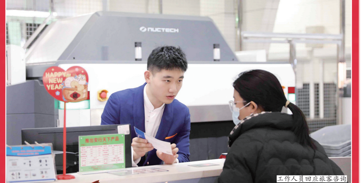
工作人员回应旅客咨询