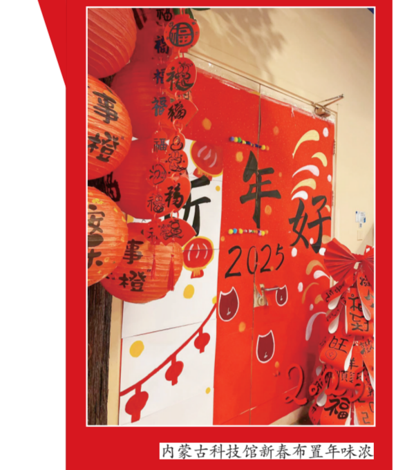
内蒙古科技馆新春布置年味浓