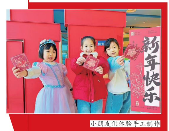
小朋友们体验手工创作