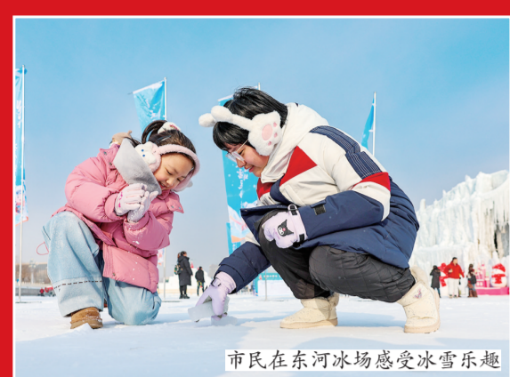
市民在河东冰场感受冰雪乐趣