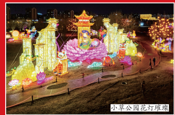
小草公园花灯璀璨