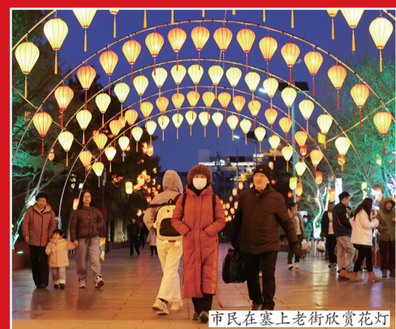
市民在家上老街欣赏花灯