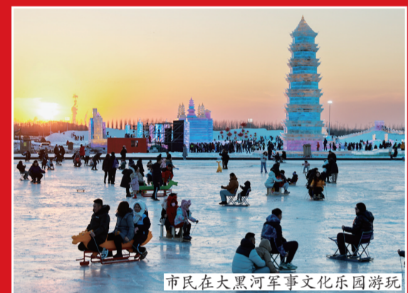
市民在大黑河军事文化乐园游玩