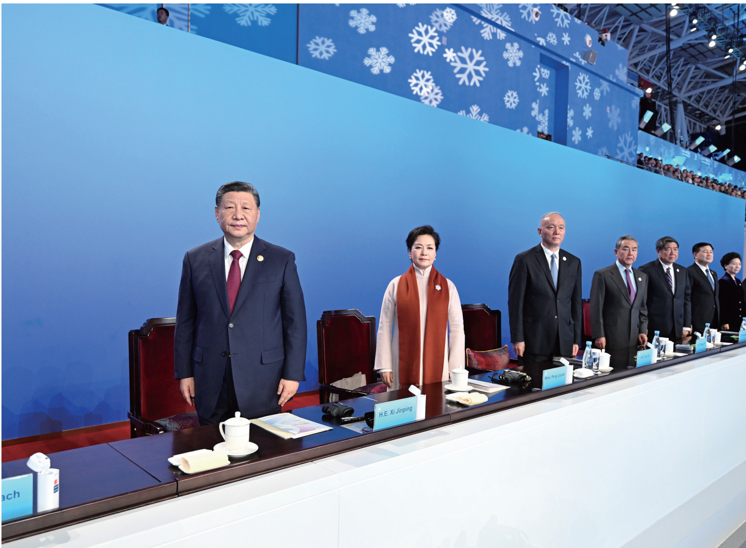
2月7日晚,第九届亚洲冬季运动会在黑龙江省哈尔滨市隆重开幕。习近平等党和国家领导人出席开幕式。