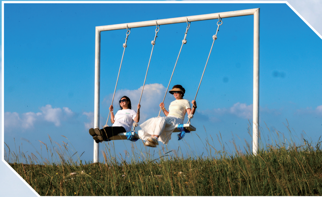
童话般的场景带你一秒回到童年