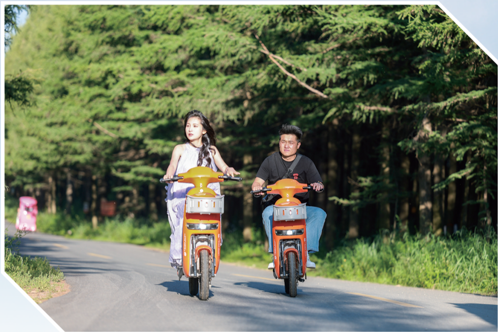
在绿意盎然中感受清风拂面的惬意

哈达门国家森林公园位于武川县境内,距呼和浩特市27公里。园内峡谷、山地、高山台地相间分布,林海与草场浑然一体,群山蜿蜒,峡谷深邃,林木葱郁,景色宜人。