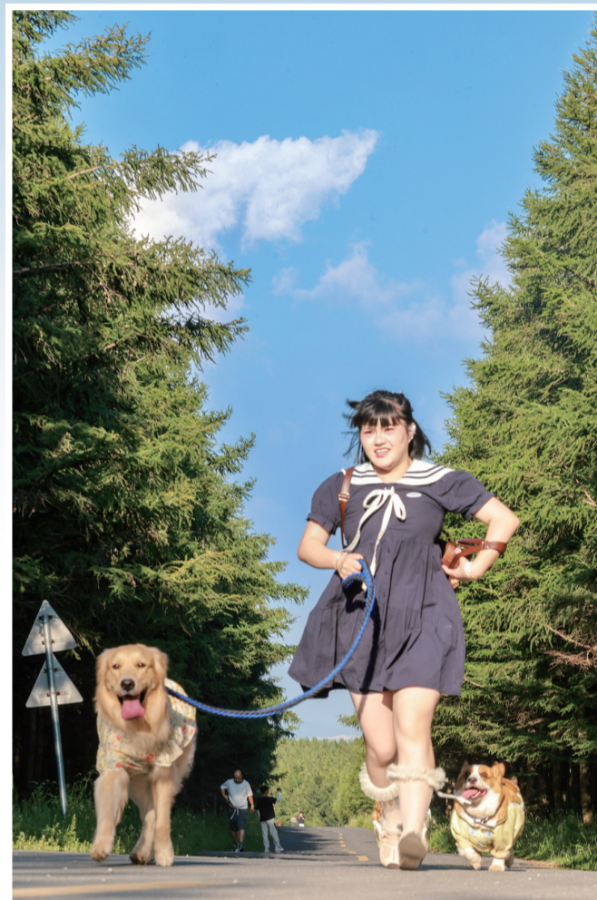
带着宠物一起领略大自然的美

踏入园内,每一次呼吸都被草木的清甜浸透,负氧离子在鼻尖轻盈跃动。连绵的松林与桦树林织就城市最天然的“氧吧”,从山脚一路铺展到天际。循着木栈道登上观景台,视野骤然开阔——大青山脉起伏如浪,苍翠林海与湛蓝天空在远处交汇,随手一拍便是“屏保级”风景。这里早已成为市民与游客共同的“洗肺”打卡地:晨跑、露营、拍照,抑或只是静静发呆,都能把喧嚣留在山门外,把清爽带回心里。