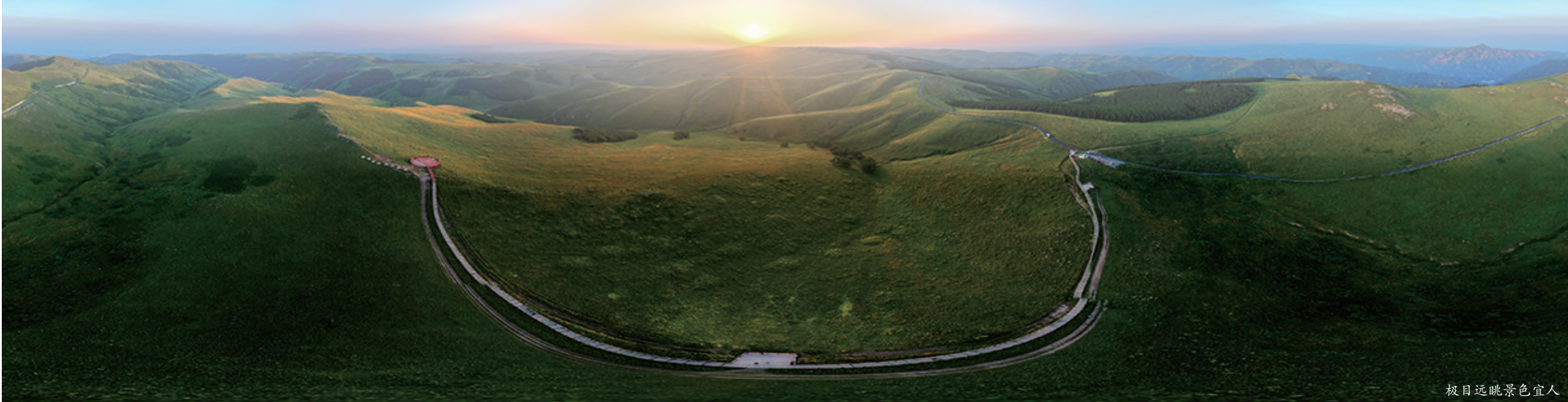
极目远眺景色宜人