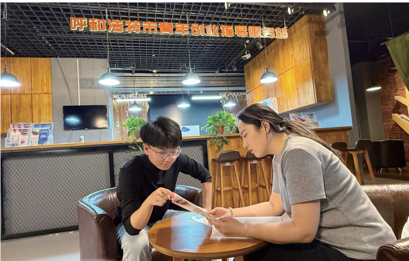
两名青年创客在创业指导服务站交流

了可以享受的创业补贴、就业补贴和社保优惠三项政策,让我们顺利完成了从‘校园项目’到‘社会企业’的关键转型。”