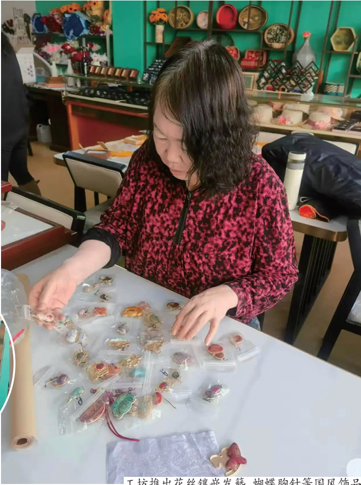
工坊推出花丝镶嵌发簪、蝴蝶胸针等国风饰品