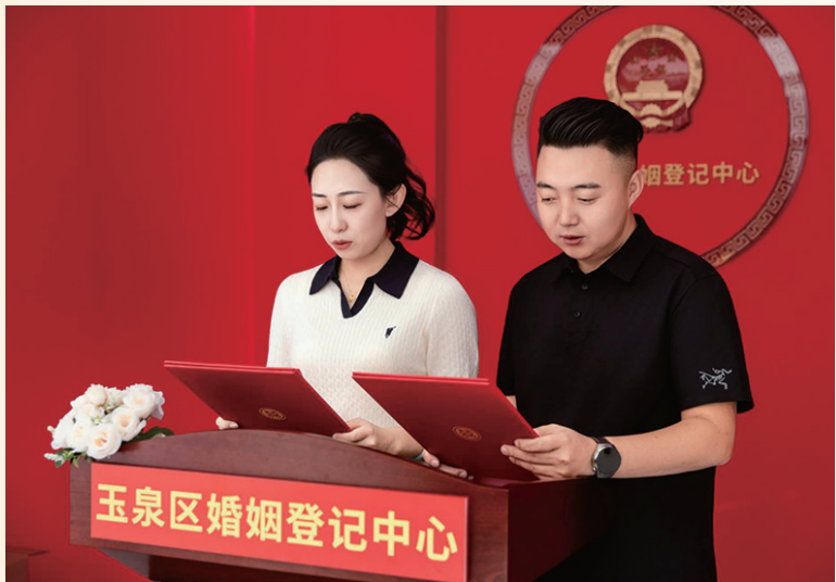
新人办理婚姻登记后宣誓

本报讯(记者 安娜)新年启封,爱意先行。2026年元旦当天,玉泉区婚姻登记中心将打破常规,于上午9:00—12:00“为爱