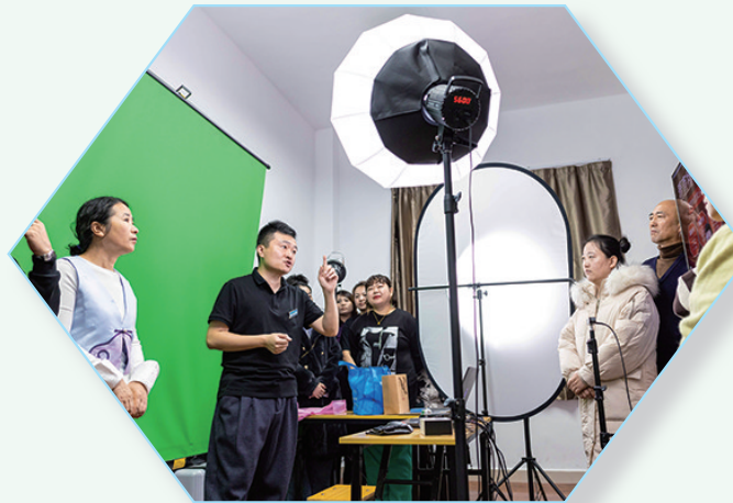
电商直播职业技能培训班讲师讲解直播灯光布置技巧