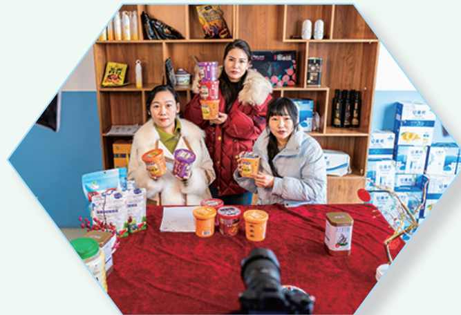
电子商务职业技能培训班学员进行直播带货实操练习