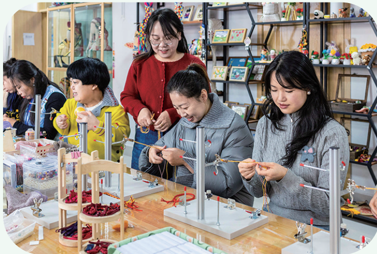
手工制作职业技能培训班学员学习编织手链绳

为提升培训实效,课程采用“理论+实操+案例”三位一体教学模式,把政策解读、就业指导深度融入培训全过程,帮助学员既掌握专业技能,又明晰就业方向。在此基础上,玉泉区人社局就业服务中心进一步构建“培训+就业”闭环服务机制,从技能教学到岗位对接全程跟进,切实保障学员“学得会、用得上、能就业”,为稳定辖区就业形势,推动群众高质量就业提供了有力支撑。