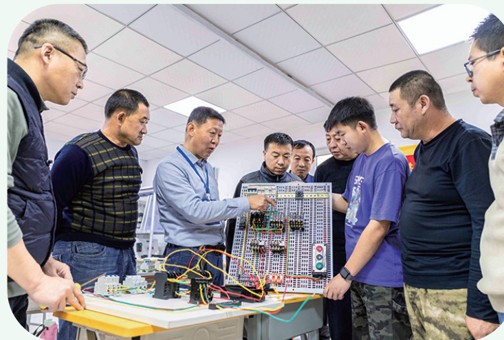
电工职业技能培训班讲师(左三)为学员讲解电路原理相关知识