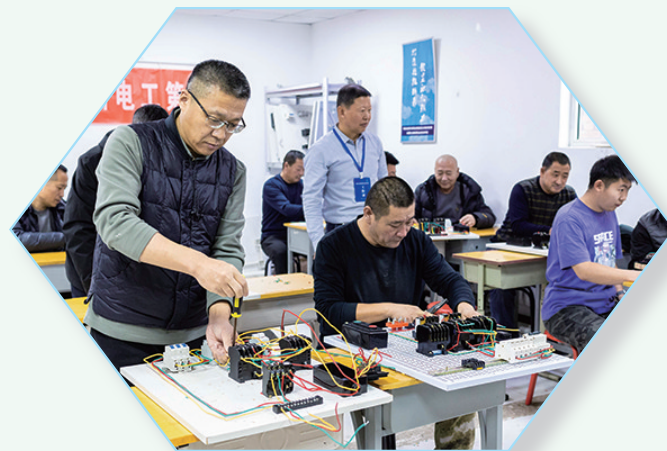
电工职业技能培训班学员进行实操练习