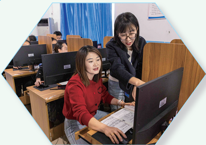
计算机操作员职业技能培训班学员进行实操练习