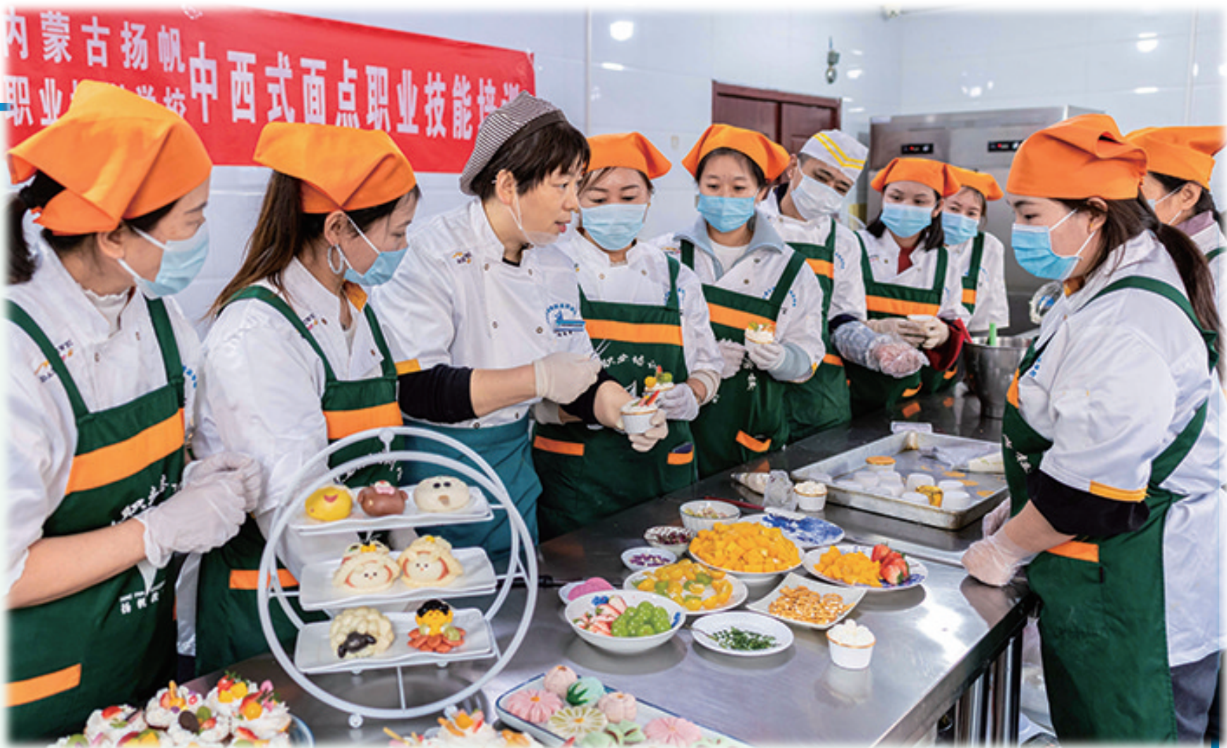
中西式面点职业技能培训班学员正在进行实操练习