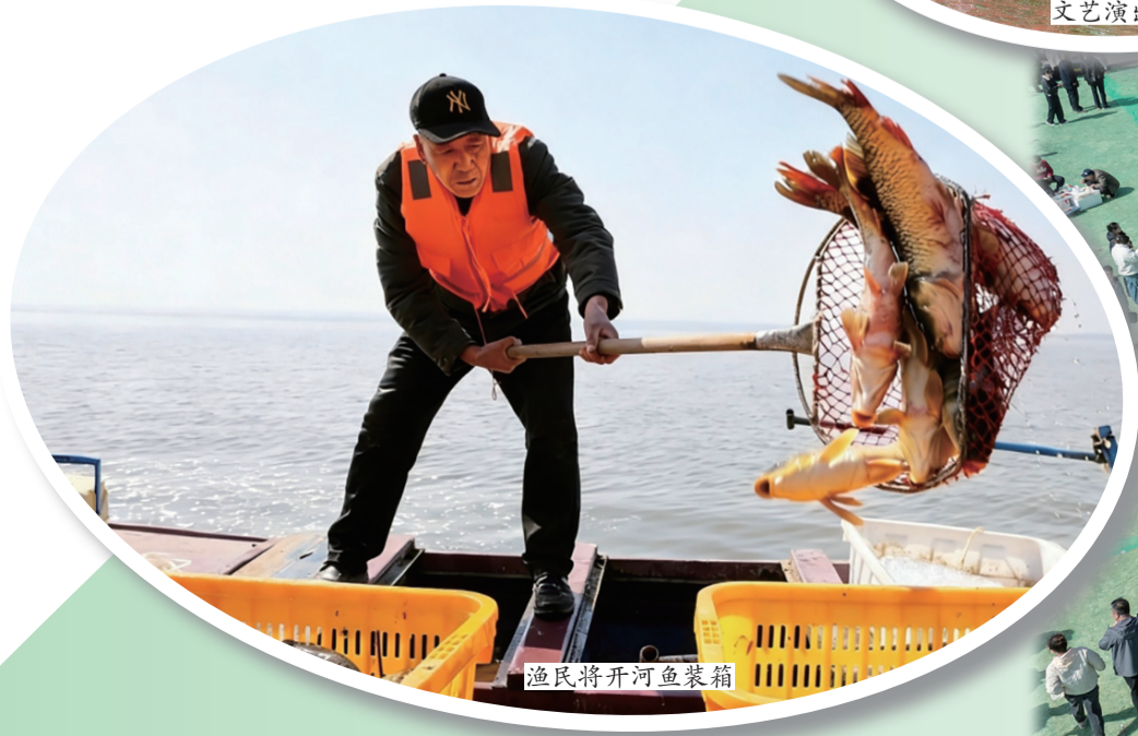
渔民将开河鱼装箱