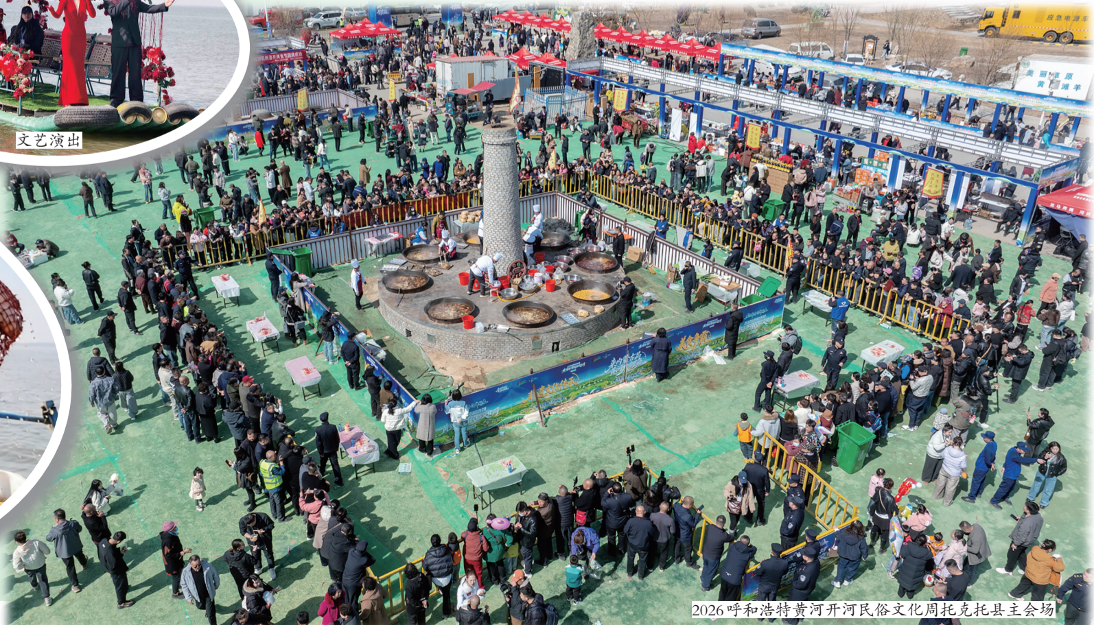
2026呼和浩特黄河开河民俗文化周托克托县主会场