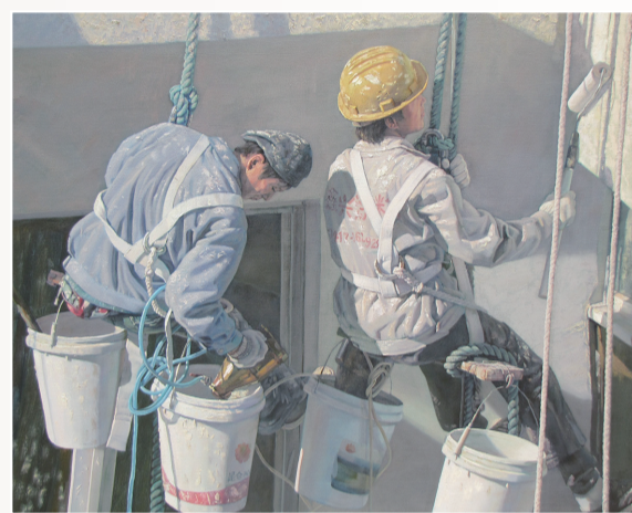
李喜成《蜘蛛人系列之一》油画 140cm×170cm 2011年(入选第十二届全国美术作品展)