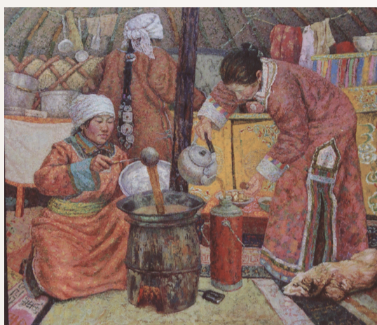
李喜成《茶香》油画 160cm×180cm 2004年(获第二届全国少数民族美术作品展金奖)