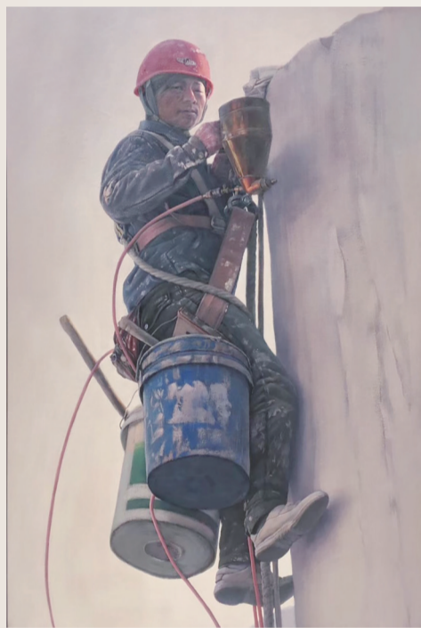
李喜成《蜘蛛人系列之三——迎接朝阳》油画 120cm×180cm 2018年(入选第七届全国(大芬)中青年油画展)