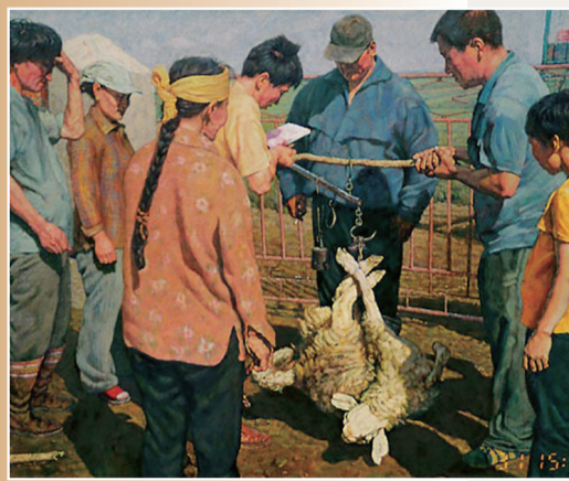
李喜成《鸟珠穆心的七月》油画 160cm×190cm 2004年(入选第十届全国美术作品展)

李喜成,1970年生于内蒙古赤峰市,1996年毕业于内蒙古师范大学美术系,2015年毕业于中央美术学院油画系硕士研究生主要课程班。中国美术家协会会员;内蒙古美术家协会理事、油画艺委会委员;内蒙古师范大学美术学院教授、硕士研究生导师。作品获第二届全国少数民族美术作品展金奖,纪念毛泽东同志《在延安文艺座谈会上的讲话》发表60周年全国美术作品展优秀奖;作品入选第十届、第十二届全国美术作品展,第三届中国油画展,“浩瀚草原”中国美术作品展,2008、2017中国百家金陵画展(油画),第五届、第七届全国(大芬)中青年油画展,第二届中国油画写生作品展,第六届中国民族美术作品展等。油画作品《邓小平访美》入选“不忘初心 继续前进——庆祝中国共产党成立100周年国家大型美术创作工程”,并被中国共产党历史展览馆收藏;油画作品《农民奔小康》入选内蒙古重大历史文化题材美术创作工程,并被内蒙古美术馆收藏。