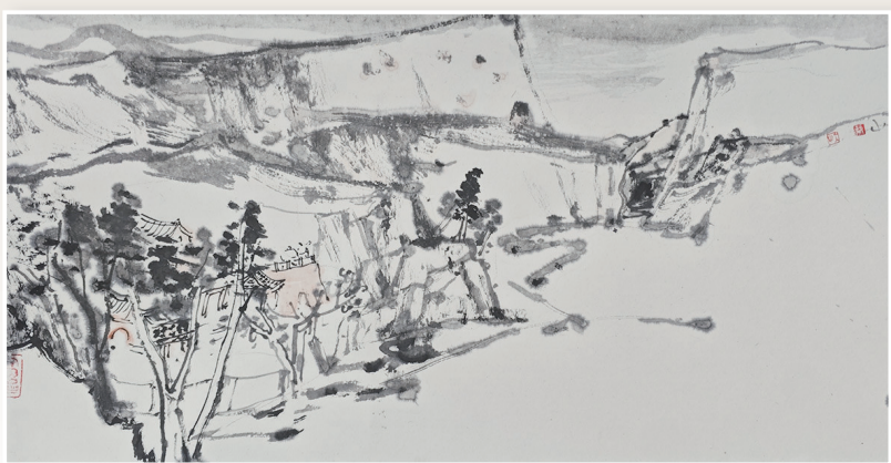
蔡大山《城图》中国画 33.5cm×67cm