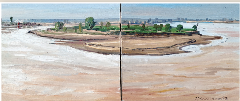
赵福《黄河托克托县什四份子段》油画 60cm×160cm