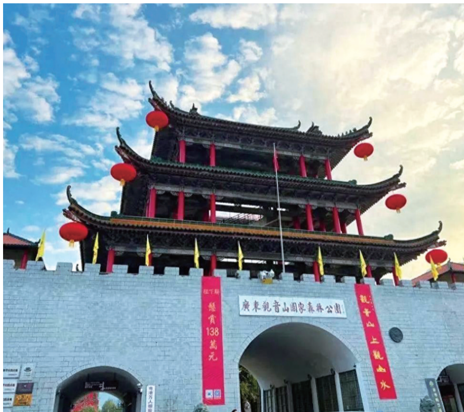
景区大门下联显示悬赏征集