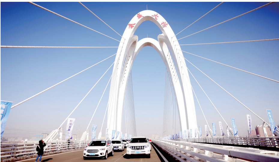
金盛快速路全线通车,市民出行更加快捷。