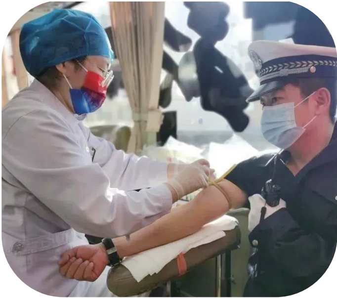
近日,赛罕区交警大队百名交警积极参加无偿献血活动,一天的时间,献血量达到10200毫升。