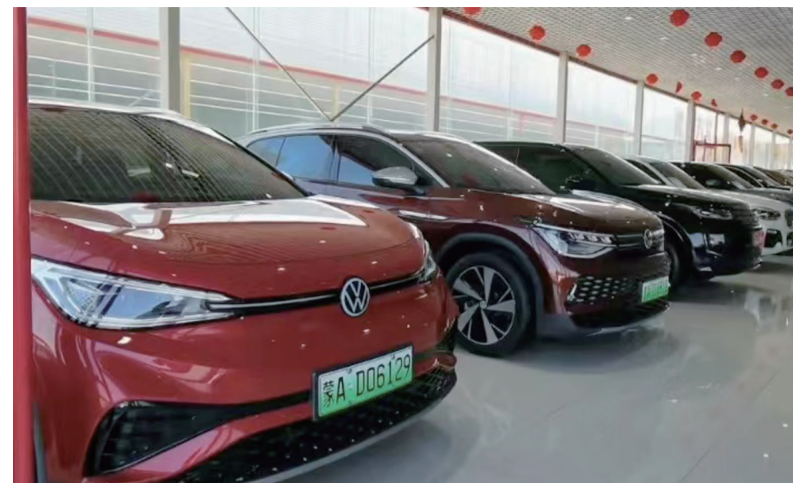
新能源汽车二手交易市场