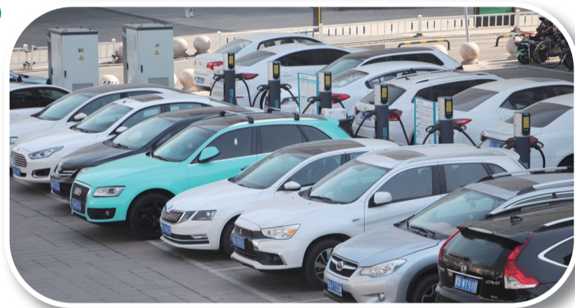
金宇新天地附近的特来电充电站

系列政策的加速出台，为推动我市新能源汽车充电基础设施建设按下“快进键”，给新能源汽车车主带来了利好消息。