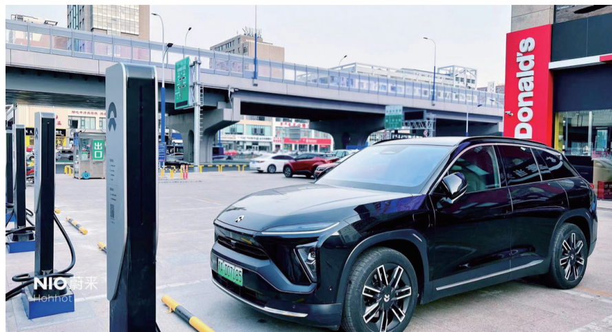
凯元广场超充站投入使用