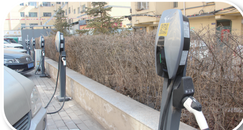
富邦小区内新建的充电桩