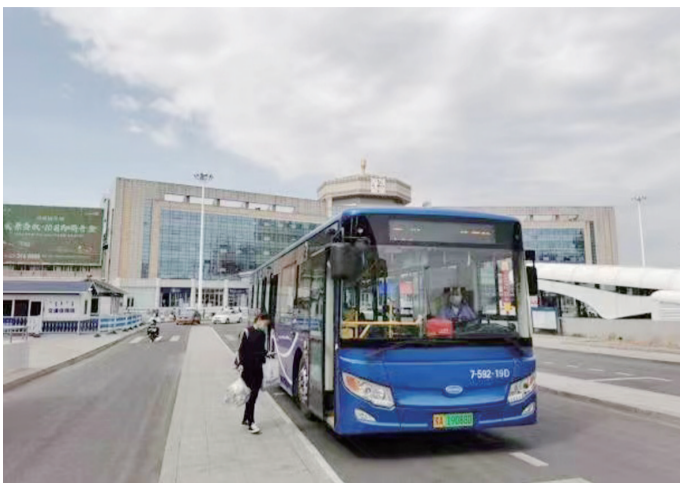
新能源公交助力绿色出行