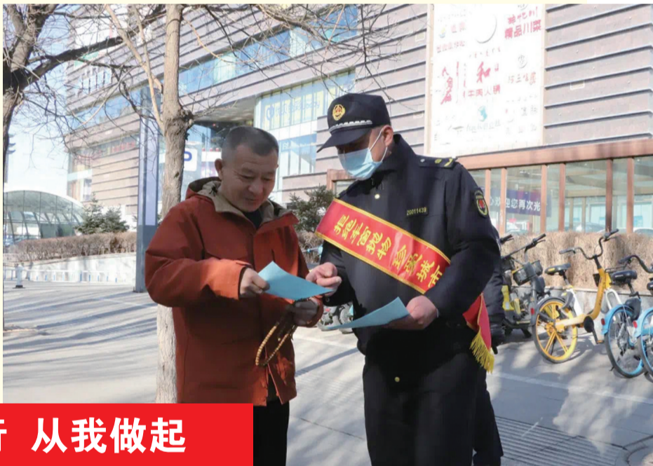
文明出行 从我做起