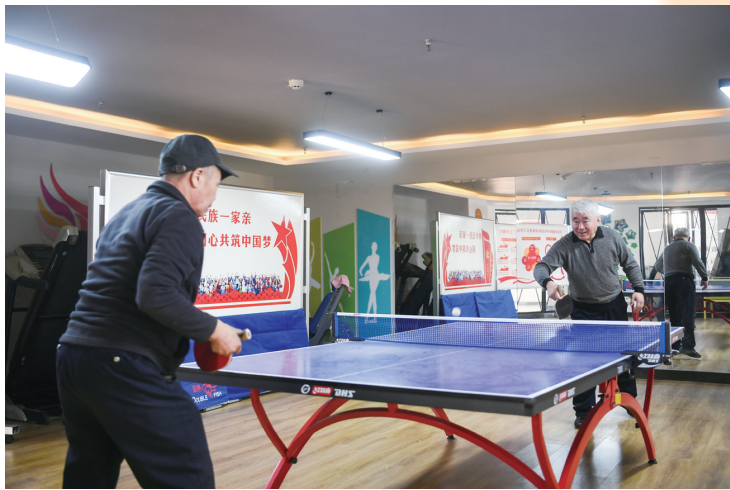
运动成为老年人生活的一部分