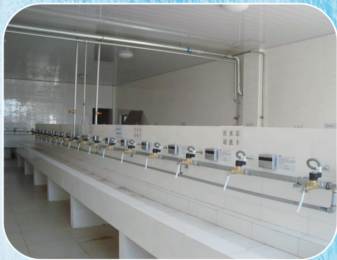
节水型高校开水间回收及阀门自动关闭系统

目前，我市9个旗县区已有5个达到《节水型社会评价标准（实行）》要求，建成率达到55.6%；2022年评选4所高校成为节水型高校，18名小学生成为节水大使；目前已运营的规模以上高耗水行业企业全部建成节水型企业；通过对各相关旗县区上报的节水型灌区材料进行复审，有4个灌区具备申报条件，同时上报自治区水利厅审核；2022年通过开展合同节水试点工作，使新城区政府实现了节水管理过程的全面智慧化覆盖，规范了其内部节水管理流程，节水管理效率大幅提升，年用水量由6万吨左右降至5万吨以下，取得了显著的节水效果。