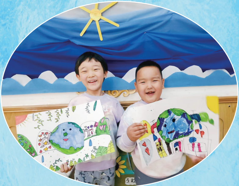
画一幅节水宣传画