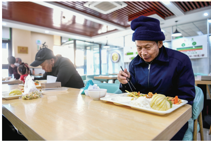
为餐厅里用餐的老人