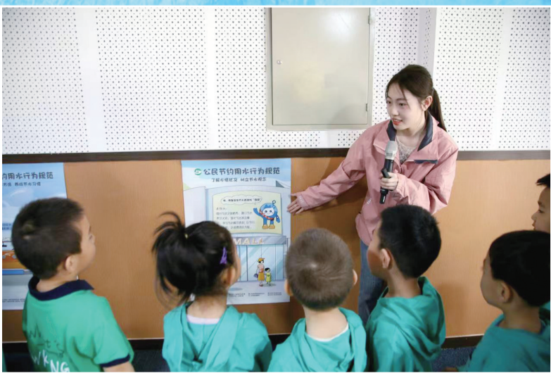
跟着老师学习节水知识