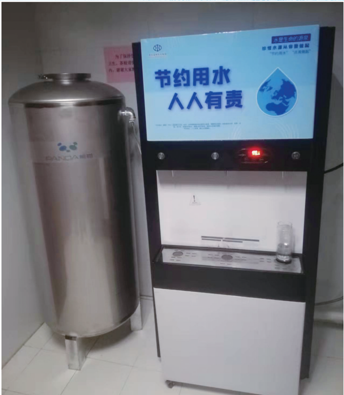
节水型机关纯净水尾水回收利用装置