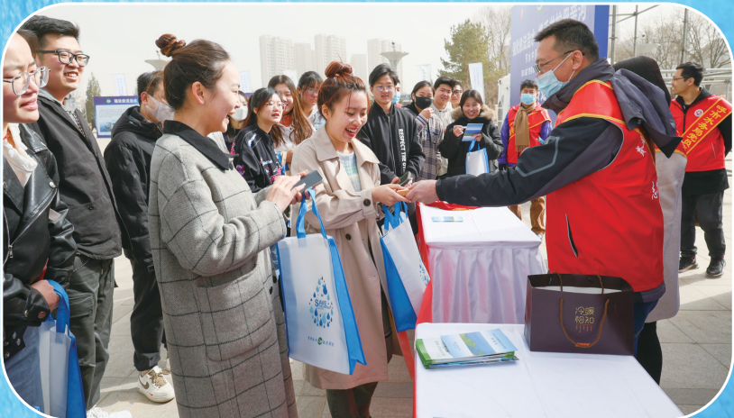
2023年“世界水日”“中国水周”节水宣传活动启动仪式现场