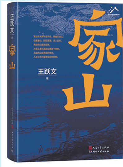
《家山》:王跃文著 人民文学出版社、湖南文艺出版社出版